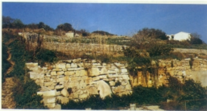
Dijelovi gradskih zidina stare Isse

ti ključnim točkama za kontrolu plovidbe i dalju ekspanziju. Preuzeo je i naselio Ankonu, Nimanu i slavnu Adriu na ušću Pada, a na osvojenom je Visu, u prostranoj viškoj luci, izgradio utvrđenu koloniju. Zbilo se to vjerojatno oko godine 397. pr. Krista. S visokog je Huma Dionizijeva straža nadzirala Jadran do linije Zadra i Ankone na sjeveru te Boke kotorske i Monte Gargana na jugu i signalizirala jakoj floti trijera u iseskoj luci pojavu drugih lađa.