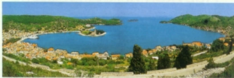
Pogled na cijelu višku luku

Dionizija Starijeg, za kojega je, kažu, napisana najstarija politička putopisa u povijesti - Platonova Država, spominjali smo i prije uz osnivanje grčke kolonije Pharos na Hvaru. Međutim, nakon smrti snažnog i nesalomljivog Dionizija Starijeg 367. godine pr. Krista, vlast je naslijedio njegov slabi sin Dionizije Mlađi i cijela se velika imperija raspala. Issa više nije sirakuška kolonija već samostalan grčki polis koji širi svoju trgovačku mrežu i podiže nova naselja, vezana uz matični grad religioznim, političkim i gospodarskim vezama. Tako su još tijekom 4. stoljeća Isejci utemeljili koloniju na Korčuli, na mjestu današnje Lumbarde. U 3. su stoljeću utemeljili koloniju Tragurion (Trogir) na otočiću između Čiova i kopna te Epetion (današnji Stobreč) na izlasku iz žrnovničke luke. Naposljetku ušli su u središnji prostor tadašnjih Ilira - Salonu i u njoj osnovali koloniju. Sva su naselja razvijala grčku civilizaciju i grčki jezik i bila u vezi s najvećim i najistaknutijim centrima grčke kulture u Grčkoj, južnoj Italiji i na Siciliji. Razvijala su poljoprivredu, stočarstvo, ribarstvo i zanatstvo te trgovinu s gotovo svim obalama Sredozemlja i sjeverozapadnim kopnenim dijelom Balkanskog poluotoka.