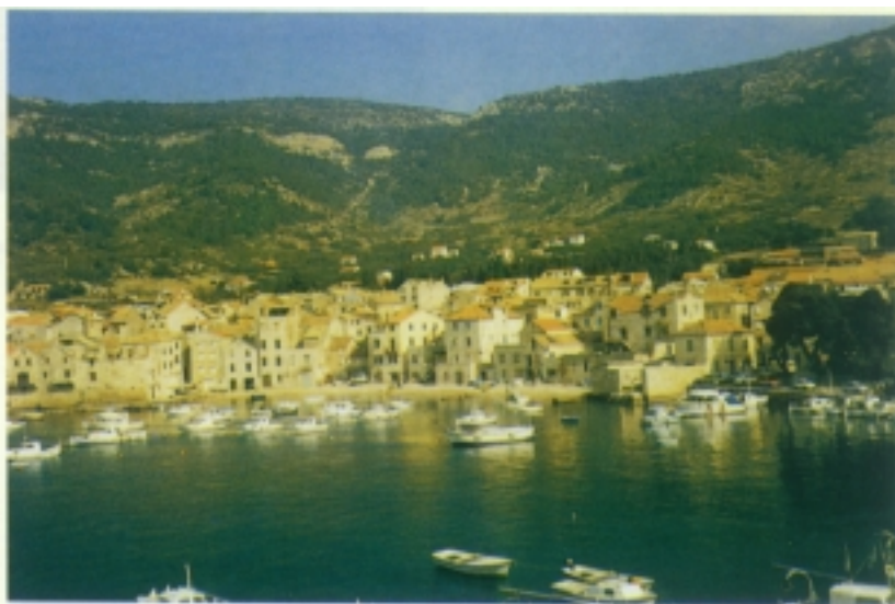
Pogled na Komižu

Komiža je smještena na zapadnoj obali otoka na sjeveroistočnoj strani