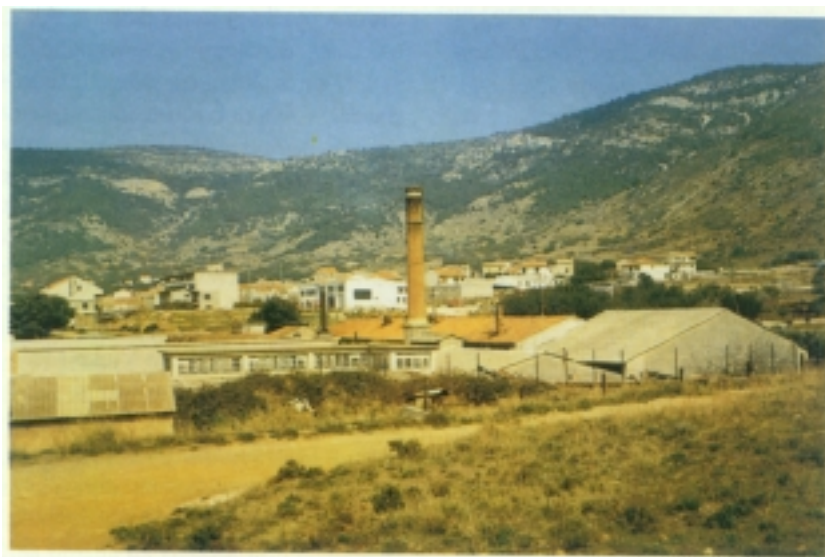
Tvornica Neptun u Komiži

Slična je situacija i s vodoopskrbom, glavnim otočkim prioritetom i nastavkom Regionalnog vodovoda. Svaki je stanovnik otoka Visa svojedobno izdvajao više od ostalih za dovod vode iz Cetine. Sustav je dijelom izgrađen, voda je preko Brača stigla do Hvara, priključila se i Šolta koja u početku nije bila ni planirana, i sve je stalo. Kada će između Hvara i