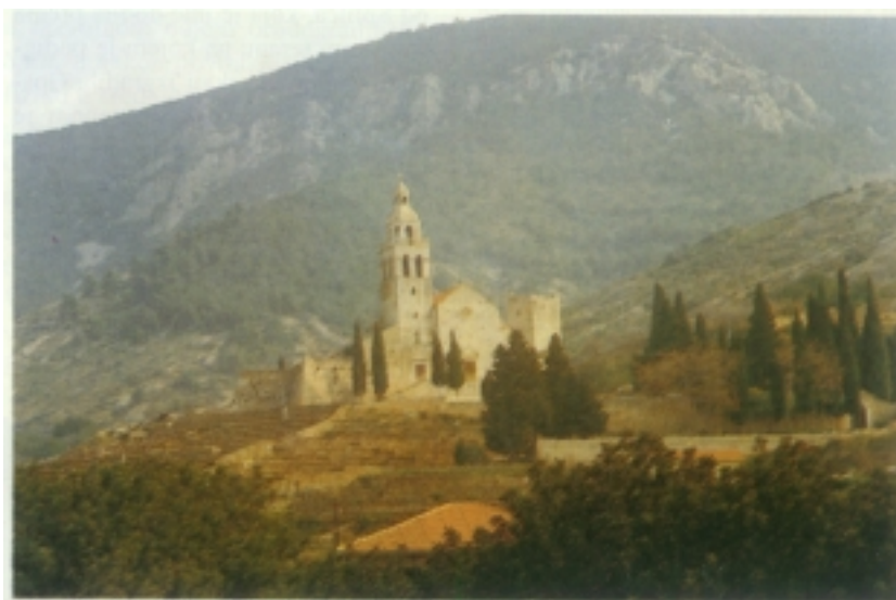
Muster - crkva i samostan Sv. Nikole u Komiži

Cijeli je otok građen od gornjokrednih vapnenaca, a slojevi se pružaju u smjeru od jugozapada prema sjeveroistoku. Tom su smjeru uglavnom prilagođeni osnovni elementi reljefa. Izmjenjuju se pretežno blago zaobljena vapnenačka bila i zatvorene krške udoline, kojima su dna zaravnjena i pokrivena rastrošenim i pjeskovitim materijalom. Takve su udoline (polja) glavne poljoprivredne površine otoka, a najveće su Dračevo polje, Plisko polje i Zlopolje.