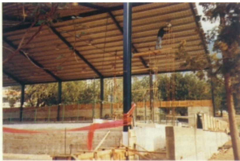
Gradnja športske dvorane u Komiži

U Visu je inače otvoren poseban odjel splitske muzičke škole Josipa Hatzea , uređena nova knjižnica, a pripremaju se preurediti poznatu Češku vilu (koju je ustupila vojska) za održavanje muzičkih manifestacija. Osnovno je i srednje školstvo uglavnom zadovoljavajuće, a za bolju zdravstvenu zaštitu otočana prepreka su neodgovarajući i mali zdravstveni prostori.