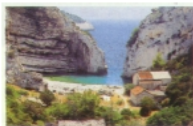
Uvala Stiniva na Visu

janska želja za potpunim ovladavanjem Jadranskim morem. Za početak osvajanja odabran je dakako Vis, koji su nazivali "Gibraltarom Jadrana". Golema je talijanska flota doplovila pred Vis 18. srpnja 1866. godine i započela napadati utvrde u Komiži i Visu. Pokušaji iskrcavanja uspješno su odbijeni u nekoliko navrata. Namjeravano iskrcavanje 20. srpnja zaustavljeno je kada je javljeno da je iz Pule isplovila cijela austrijska flota i da se približava Visu.