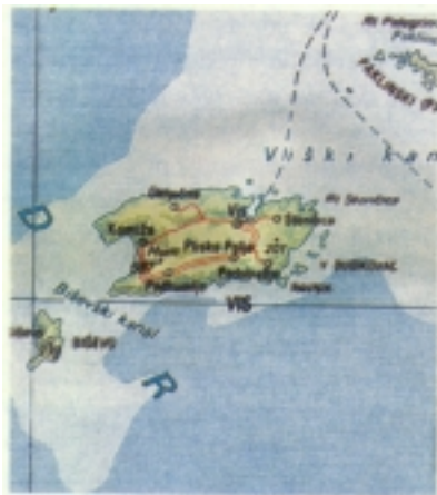
Zemljovid otoka Visa

Iako Vis obiluje raznovrsnim povijesnim spomenicima iz pet tisućljeća duge i neprekinute nastanjenosti, pomalo je neobičan podatak da je jedan od najstarijih sačuvanih spomenika njegovo ime. Naime Issa,