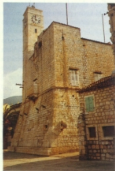
Kaštel u Komiži

nego što je otok prije imao stanovnika. Ojačale i snažne partizanske jedinice s Visa izvodile su desantne napade na obližnje srednjodalmatinske otoke. Od 7. lipnja do 15. listopada Vis je bio sjedište Vrhovnog štaba s Titom na čelu. Tito je boravio u špilji iznad sela Borovika, a s Visa je rukovodio vojnim i diplomatskim operacijama.