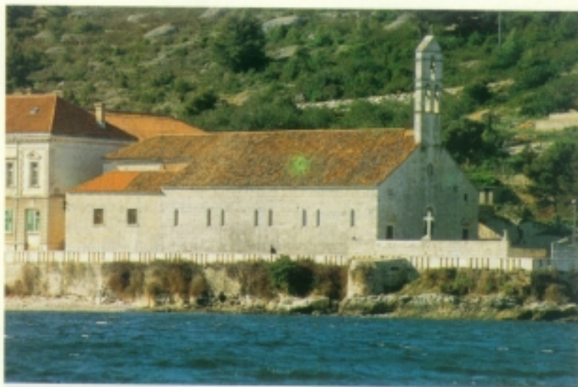
Crkva Gospe od Spilica u Visu

Preostalo se stanovništvo u strahu od gusara povuklo od mora, u brda i udaljena polja. Vis je sastavnim dijelom hvarske komune, a zemlja je u vlasništvu plemića, crkve i hvarske komune. Domaće je stanovništvo ili u kolonatskom odnosu s vlasnicima zemljišta ili se bavi ribolovom, koji se osobito razvija u 15. i 16. stoljeću. Vis je 1420. godine zajedno s Hvarom i cijelom Dalmacijom došao pod vlast Venecije. U sukobima između Venecije i vojvode Ercola od Ferrare, flota napuljsko-aragonskog kralja Ferrantea, Ercolova savezni-