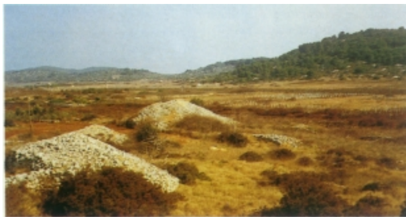
Pogled na dio prostranoga viškog polja

Bitka je započela u 10,45, a završena je oko 15 sati potpunom austrijskom pobjedom i bijegom poražene flote prema Anconi. Pobjeda pod Visom bila je od neprocjenjive vrijednosti ne samo za austrijske interese i ciljeve već i za hrvatsko narodno osvješćenje i preporod jer su najbrojnija posada austrijskih ratnih brodova bili upravo primorski Hrvati. Bilo je stoga mnogo slavlja, veselja i pjesama. Iako talijanska flota nije viškom bitkom bila ozbiljno