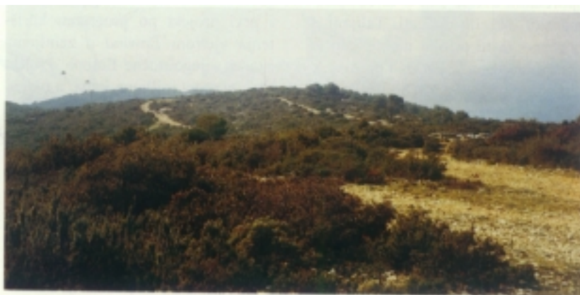
Vrh rta Stupišće na kojemu će se graditi vjetropark

Uz pomoć Centra za otoke proširena je riva u uvali Mezuporat na Biševu odakle se gliserima i trabakulima odlazi do Modre špilje. Tijekom 1997. godine Centar je investirao i u obnovu oštećenog komiškog lukobrana, a radove je izvodio splitski Pomgrad . U planu im je uređenje zgrade bivše vojarne u dom umirovljenika. Planirali su to obaviti do ljeta no vjerojatno će rokovi biti produženi. Zgrada će biti adaptirana za dva-desetak štićenika, a predviđeno je i