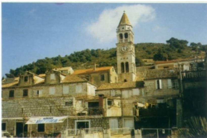
Kut - dio grada Visa

Ipak Isejci, zahvaljujući svom znanju i iskustvu, zadržavaju upravu