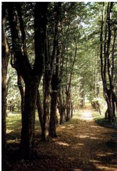
Aleja grabova u perivoju

Začetke perivoja uz suhopoljski dvorac naći ćemo u drvoredima kraja 18. i početka 19. stoljeća, koji su odredili granicu poslije uobličena perivoja. Drvored bijelih topola išao je sjeverozapadnim rubom perivoja, drvored lipa sjeveroistočnim rubom, odnosno duž ceste Virovitica-Osijek, a drvored hrasta južnim rubom perivoja, duž puta što je vodio prema imanju Lepirovac, istočno od Terezovca. Mihovil pl. Kunić spominje 1834. godine drvored na prilazima Terezovcu: drvored jablana (vjerojatno posađen u doba Napoleona početkom 19. stoljeća) te drvored mladih kestenova i platana, koji naziva "najljepšim drvoredom u Hrvatskoj".