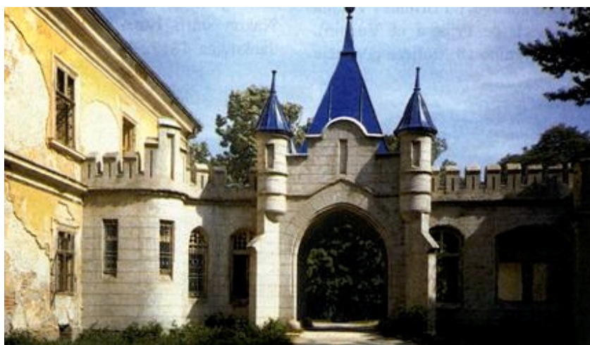
Neogotički ulza u dvorac