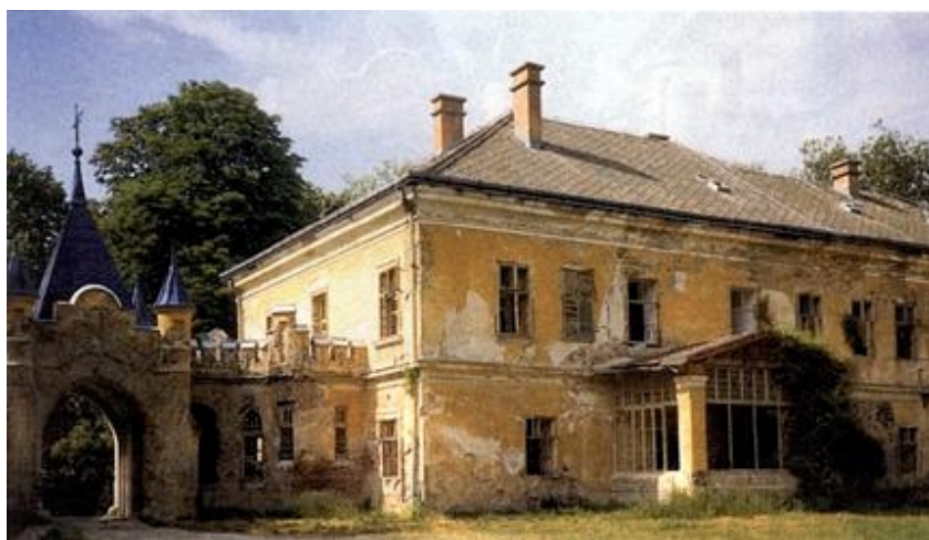
Jugoistočno pročelje dvorca

napustio Suhopolje i preselio se u Mađarsku, gdje je posjedovao vlastelinstva Gicz i Öreglak. Suhopolje je prodao 1931. godine.