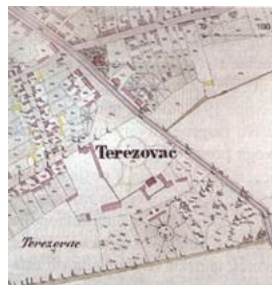
Katastarska karta iz 1862. godine