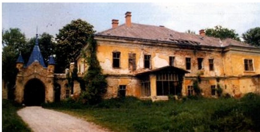
Sadašnje stanje zapuštenog jugoistočnog pročelja