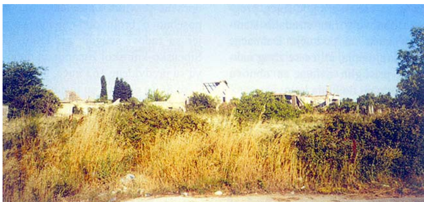
Još nije počela obnova razorenog Smokovića

nja oštećenih kuća, izrade uputa za obnovu i njihove revizije, preko izgradnje i tehničkog pregleda do pri-