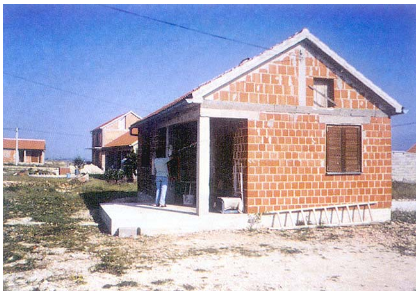
Obiteljska kuća pred završetkom obnove u središtu Paljuva

U program obnove obiteljskih kuća u Dalmaciji uključene su 23 građevinske tvrtke koje navodimo po broju kuća koje trenutno obnavljaju. Napominjemo da su ovdje obrađeni samo podaci koji su se nalazili u izvješću od 18. lipnja 2001., a uključene su samo one obiteljske kuće na kojima su radovi u tijeku a ne i one koje su uvedene u posao, pa se možda taj broj izmijenio: Najviše kuća obnavlja Gra-med (31, od kojih je 10 prošlo tehnički pregled), slijedi Tolo (27, od kojih je završeno 8), Team Čakovec (27), Ibis Zadar (22), Oziris i Gortan Zadar (sa po 21), Lavčević , Split (19), Vruljica , Ran , Šibenik i Fortis , Imotski (svi po 18), Lavčević , Šibenik (17), Alkom-grad , Sinj (16), Vodoprivreda i Lavčević , Zadar (po 12), IC-IM , Imotski (11), Pul-grad , Zagreb (9), Gradina , Drnš i