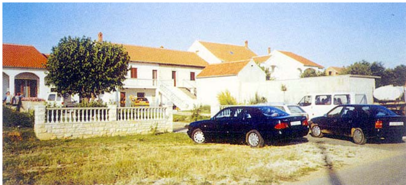
Skupina obnovljenih kuća u Škabrnji

mijenjaju, onda kada je riječ o broju kuća u obnovi (što najčešće ovisi o upravno-pravnim problemima), a posebno o broju obnovljenih kuća jer su radovi svugdje pri kraju. U Šibensko-kninskoj županiji za obnovu su predviđene 163 kuće, obnavlja ih se 86 (u obnovu su uvedene 103),