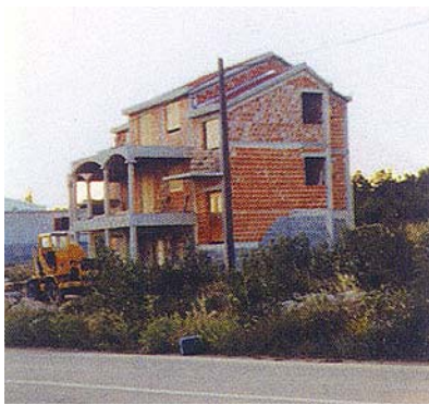
Jedna obnovljena kuća u Maslenici (Jasenici)

težno srpskim stanovništvom u koje se izbjeglo stanovništvo nije vratilo pa i nije bilo zahtjeva za obnovu. No i u takva se sela vraćaju njegovi nekadašnji stanovnici, ali uglavnom u većim grupama.