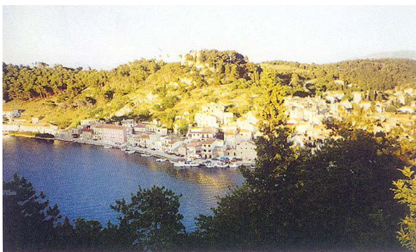
Pogled na Novigrad

na prošao kroz potpuno razorena, devastirana i napuštena sela. Sve se crveni od novih kuća i u mnogim je mjestima tragove negdašnjeg rata gotovo nemoguće zamijetiti. Posebno impresivno djeluje Škabrnja gdje je i većina pročelja uređena i ožbukana. U ovo veliko i bogato selo očito se život vrlo brzo vraća, a stradanja i strahote se pomalo zaboravljaju. Dojam je da su se u sva ta sela vratili gotovo svi prognanici i da su svi počeli živjeti i raditi kao u to nekada. Doduše, na tom smo obilasku uočili i mnogo ruševina, ali kao što smo rekli, riječ je o selima s pre-