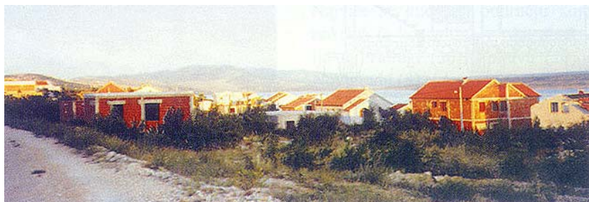
Skupina obnovljenih kuća za postradale Jaseničane

No to ipak ne znači da s korisnicima nije bilo nikakvih problema, zaključio je svoje izlaganje ing. Čukelj, koji se inače u obnovu uključio tek nedavno. Ima i dalje korisnika koji zahtijevaju i traže mnogo više nego što po Zakonu o obnovi na to imaju pravo. No takvih je prije bilo znatno više, sada su već svi upoznati s pravilima i zato ima vrlo malo problema. Štoviše svima onima koji su prije odbijali da im se kuće obnavljaju po ponuđenim uvjetima, upućeno je