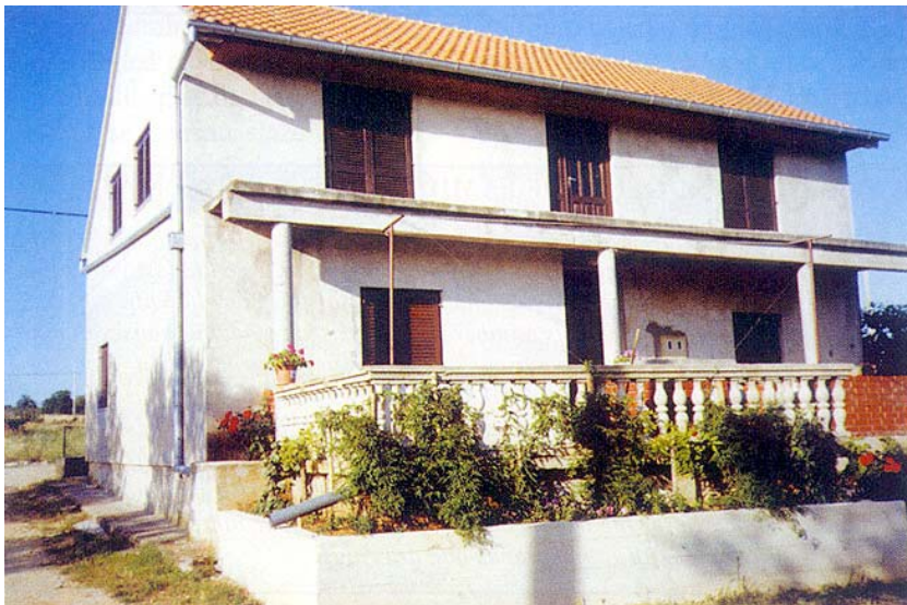
Prva obnovljena kuća u Škabrnji

osnovne škole u Pridragi, koju upravo završava splitski Konstruktor . Inače rok za završetak ovogodišnjeg programa obnove u ratu stradalih stambenih kuća na području Dalmacije bio je kraj lipnja, ali će se zbog naknadno pristiglih naloga za obnovu rok produžiti do kraja kolovoza.