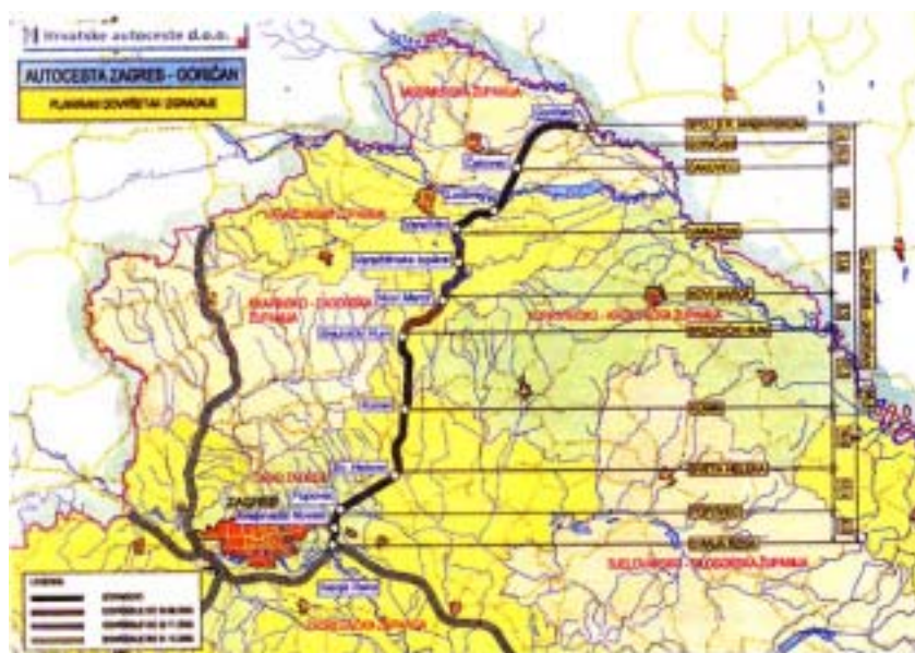
Prikaz dionica Zagreb – Macelj i Zagreb – Goričan