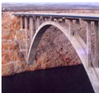
Pogled na Maslenički most

ljevo – Ogulin ovog su ljeta imali koristi samo oni koji su išli prema Senju, jer se kod Josipdola autocesta spaja s postojećom starom zavojitom cestom Duga Resa – Josipdol – Žuta