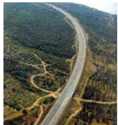
Dio autoceste na dionici Sv. Rok - Maslenica

Prednosti putovanja autocestom iz unutrašnjosti na more, ovog su ljeta najviše osjetili oni koji su putovali u Zadar. Naime, izgrađena je dionica od tunela Sveti Rok (čvorište Gornja Ploča) do Zadra. S postojeće se ceste D1 (Zagreb – Split) kod Udbine skreće se na novu cestu koja vodi do čvorišta Gornja Ploča, gdje počinje