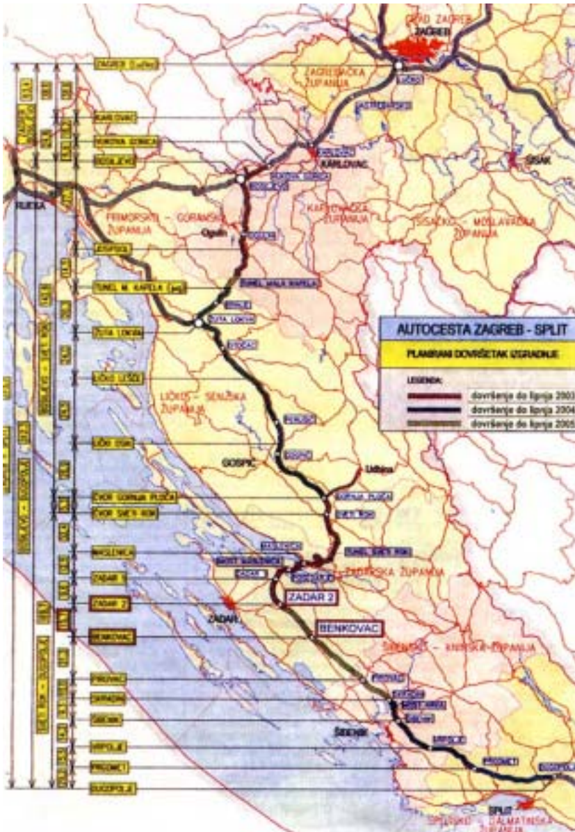
Prikaz autoceste Zagreb - Split

četiri velika pravca – Zagreb – Split, Zagreb – Rijeka, Karlovac – Ogulin – Senj i Rijeka – Split, odnosno Jadranska turistička cesta, poznatija kao Jadranska magistrala. Naime od Zagreba do Bosiljeva, što je gotovo pola puta od Zagreba do Rijeke, vodi ista