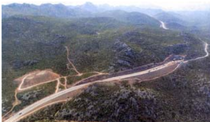
Detalj autoceste Zagreb-Split u velebitskom masivu

autocesta kroz tunel Sveti Rok i dalje preko Masleničkog mosta do čvorišta Zadar 1 i Zadar 2. S čvorišta Zadar 2 skreće se za grad Zadar, zasad još uvijek postojećom cestom, doduše malo obnovljenom i proširenom, jer će nova četvertračna brza cesta dužine 15 kilometara od čvorišta Zadar 2 do grada i nove zadar-ske luke Gaženica, kroz tunel ispod aerodroma Zemunik, biti završena tek 2005. godine.