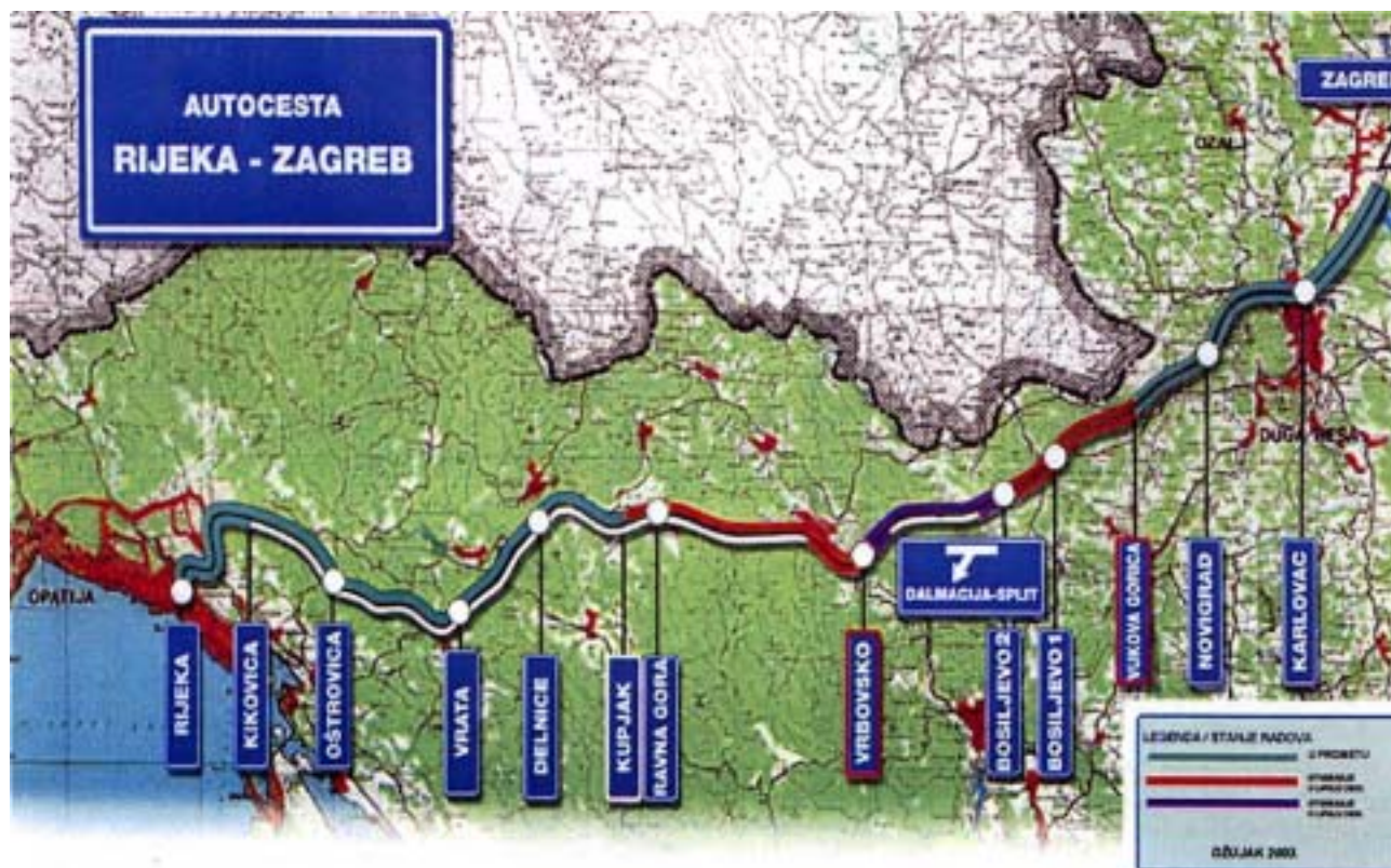
Pregledna karta autoceste Rijeka - Zagreb

Autoceste Rijeka-Zagreb duga je 146,50 km, a od toga se dio od Zagreba do Bosiljeva poklapa s autocestom Zagreb-Split u duljini od 63,0 km. Prije ljeta ove godine (2003.) pušten je u promet nastavak autoceste u punom profilu od Vukove Gorice do Bosiljeva 1 (6,93 km) te Bosiljevo1-Bosiljevo2 (3,76 km). U interregionalnom čvoru Bosiljevo2 (2,885 km) odvajaju se autoceste za Split i Rijeku. Tih je dana puštena u promet dionica Kupjak-Vrbovsko u duljini od 17,78 km, a od toga je 6,84 km u punom profilu autoceste s tri vozna traka u oba smjera. Do ljeta sljedeće godine spojit će se preostali dio autoceste od Vrbovskog do čvora Bosiljevo2 u duljinu od 13,57 km. U Autocesti Rijeka-Zagreb d.d. , društvu za građenje i gospodarenje autocestom izrađen je detaljan plan dinamike radova II. faze izgradnje autoceste Rijeka-Zagreb koja obuhvaća radove na kompletiranju cijele trase na puni profil autoceste. Ti će se radovi izvoditi na dionicama od