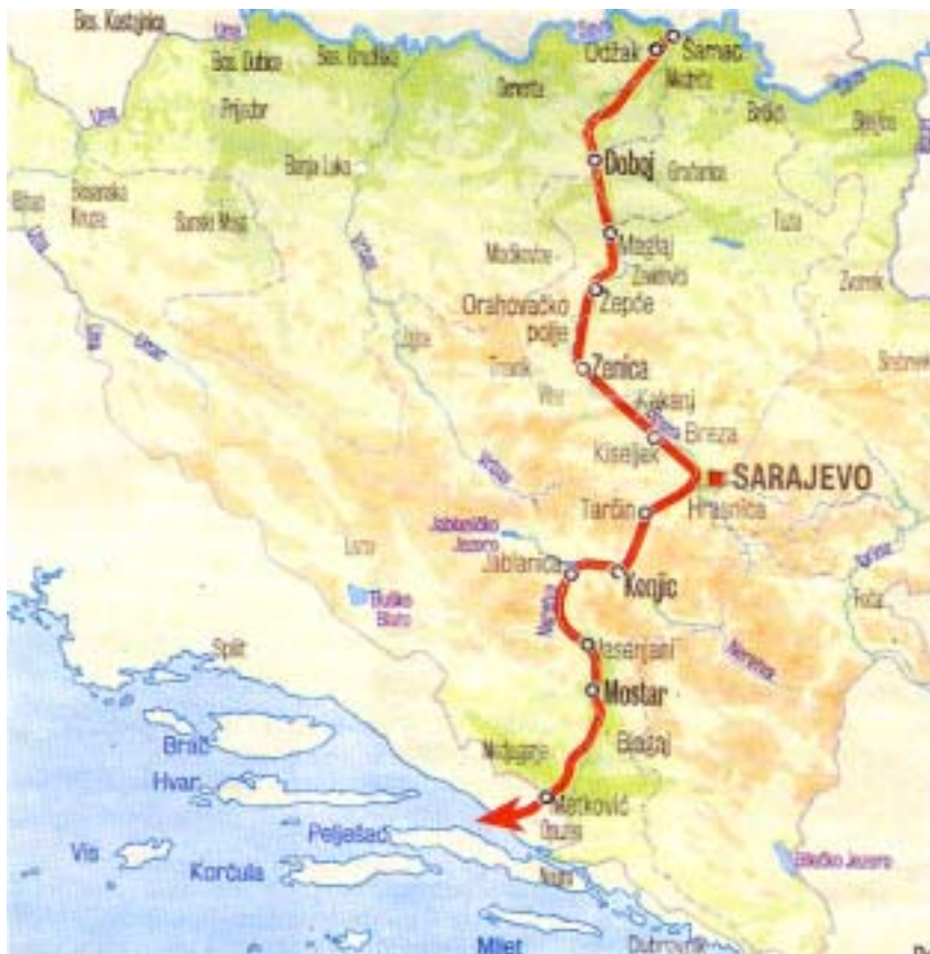
Prikaz prometnog koridora 5C kroz Bosnu i Hercegovinu

Neum, a o tim pregovorima ovisi i trasa autoceste prema Dubrovniku. Naime, ako se ne postigne dogovor, ili se pregovori budu beskrajno produživali, mogla bi trasa ići mostom