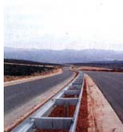
Detalj Autoceste Zagreb - Split na dionici Maslenica – Zadar 1

Prema Vladinu planu, nakon završetka autoceste do Splita slijedi nastavak izgradnje sve do Dubrovnika, do kojeg bi autocesta trebala stići do 2008. Do tada bi Hrvatska trebala dovršiti cijelu mrežu novih autocesta, što je otprilike 800 kilometara. U to je potrebno uvrstiti tridesetak preostalih kilometara autoceste Zagreb – Lipovac, odnosno dionicu Županja – Lipovac, zapravo do granice sa Srbijom i Crnom Gorom. Početkom 2004. trebalo bi započeti gradnju gotovo dvadeset kilometara duge dionice od Velike Vesi do Macelja i poluautocesta Jankomir – Zaprešić (dugu 6,4 km) na autocesti Zagreb – Macelj pretvarati u autocestu.