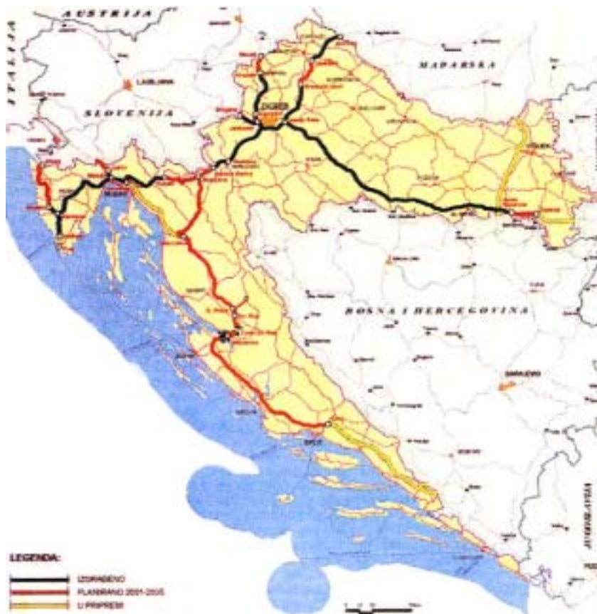
Prikaz svih autocesta u Hrvatskoj

Kad bude gotova, uoči ljeta 2005., autocesta Zagreb – Split bit će duga 376 kilometara. Od toga je šezdesetak kilometara od Zagreba do Vukove Gorice već otprije u funkciji, a početkom ovogodišnjeg ljeta puštene su u promet dionice Vukova Gorica – Bosiljevo (6,6 km) i Udbina – Gornja Ploča – Zadar 2 na autocesti Zagreb – Split, u dužini od 61 km, pri čemu je jedan dio obilaznica Udline i spojna cesta. Kada autocesta bude potpuno završena, vožnja od Zagreba do Splita trajat će umjesto