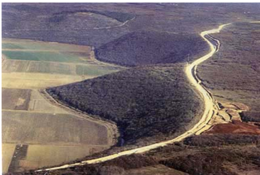
Prilazna cesta gradilištu mosta