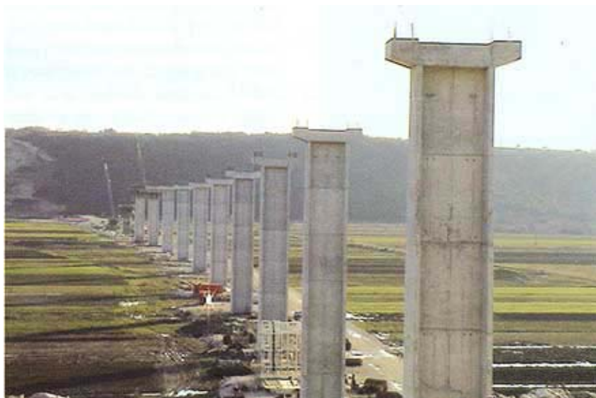
Pogled na niz izvedenih stupova

Čeličnu konstrukciju mosta isporučuje i ugrađuje specijalizirana talijanska tvrtka Cimolai iz Pordenonea. Rekao nam je da sve teče u zacrtanim rokovima i da će se naguravanje konstrukcije obavljati u taktovima i u segmentima od 120 do 150 m, tako da je sa svake strane potrebno otpri-