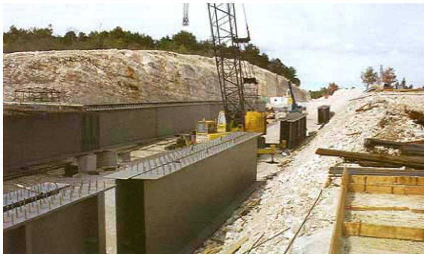
Montaža čeličnih nosača

like 6 taktova. Naguravanje se obavlja uz pomoć hidrauličnih strojeva, a teče vrlo sporo i očekuje se da će se čelični sklopovi spojiti na sredini mosta negdje tijekom kolovoza. To znači da će sve biti završeno u sljedeća dva mjeseca, baš onako kako je planirano. Potom slijedi izrada kolničke ploče i kolničke konstrukcije te ugradnja opreme.