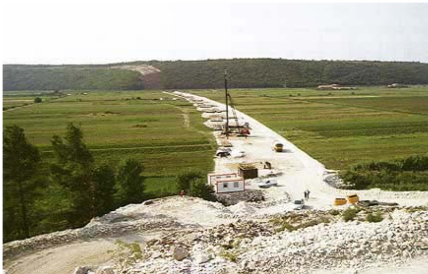
Gradilište mosta uoči početka gradnje stupova

P21) temeljeni su plitko na stijeni i na pločastim temeljima. Stupovi P3 do P19 temeljeni su na zabijenim pilotima. Nad pilotima se izvode naglavne grede debljine 2 m u koju piloti pri izvedbi ulaze najmanje 1 m.