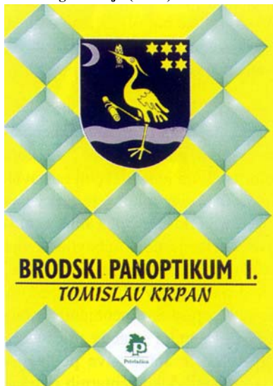
Naslovna stranica Brodskog panoptikuma I.