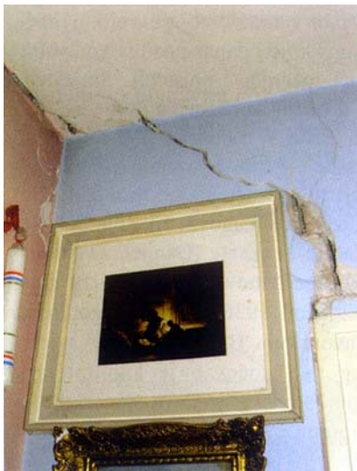
Pukotina u zidu kao uspomena na Domovinski rat