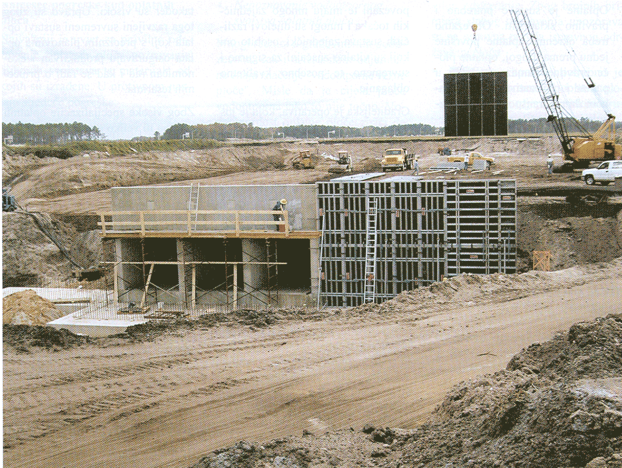
NOE top, izlaz pokraj aerodroma Orlando, Florida

nje najma i potom otkupa iz najma. Tako najam oplate u Njemačkoj i Austriji te Mađarskoj i Češkoj čini 80 posto ukupne realizacije. Razlike u veličini tvrtke nisu osobito značajne.