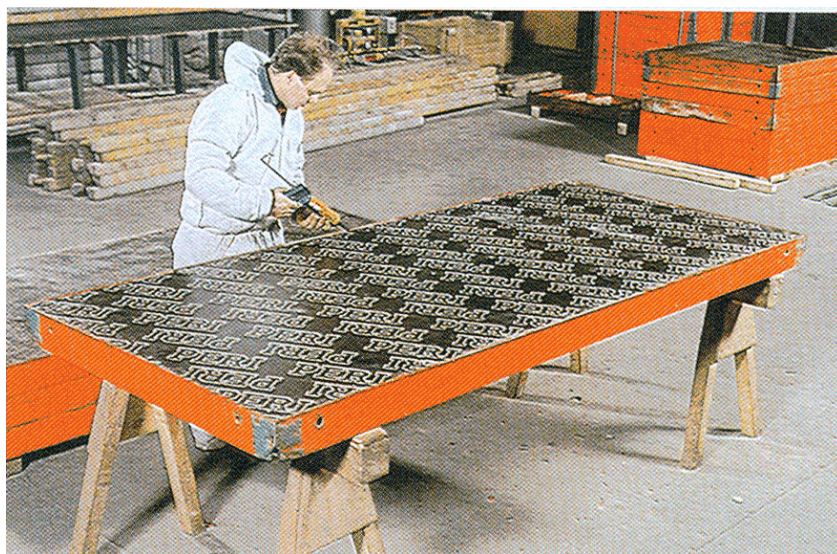
Popravak i čišćenje rabljenih drvenih oplatnih ploča