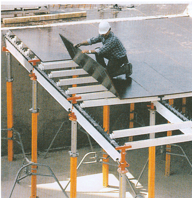
Postavljanje drvenih oplatnih ploča

Za bolje predstavljanje moraju se najprije raščlaniti vrste oplatnih ploča na našem tržištu: