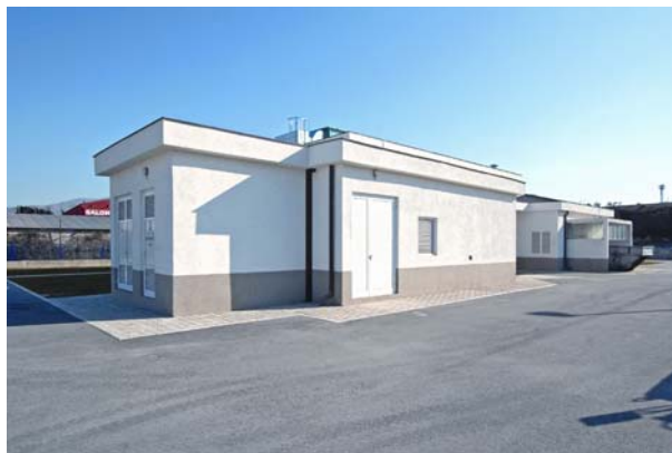
Slika 3. Crpna stanica Dujmovača

U crpnu stanicu otpadna se voda dovodi gravitacijskim kanalima koji se spajaju u spojnom oknu: kanalom K-51 (izveden AC cijevima 800 mm i L = 1 722,50 m) i kanalom K-52 (izveden AC cijevima 300 - 600 mm i L = 325,00 m).