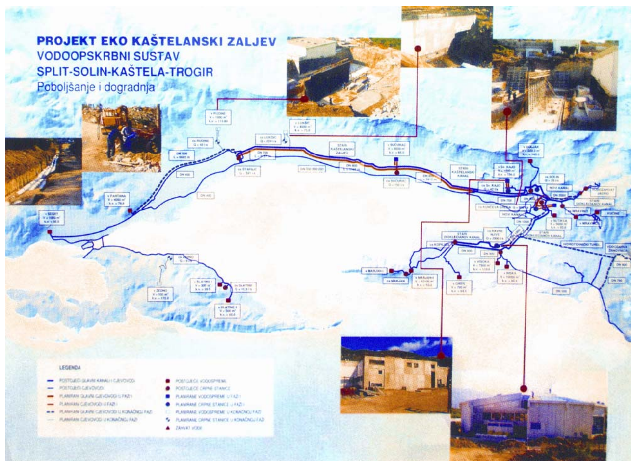
Slika 6. Situacija vodoopskrbnog sustava gradova Splita, Solina, Kaštela i Trogira