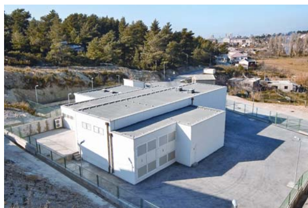
Slika 5. Građevine na lokaciji Kunčeva Greda

U poboljšanju vodoopskrbnog sustava Split-Solin-Kaštela-Trogir su i radovi na grupi građevina na lokaciji Kunčeva Greda koji se sastoje od: zahvatne građevine koja ima zadatak da regulira preusmjeravanje potrebne količine vode za gradove Solin, Kaštela i Trogir iz Splitskog kanala u novi dovod (Ø 1 200) i stari kaštelanski kanal, zatim crpne stanice Kunčeva Greda koja preko novog dovoda (Ø 1 200) prima vodu i tlači je do vodospreme Sutikva nova (kapaciteta 5 000 m 3 ) preko tlačnog cjevovoda (Ø 800 mm, duljine 600 m) iz koje se zatim distribuira u mrežu niske zone Solina opskrbnim cjevovodom (Ø 600/400 mm, duljine 1 500 m). Crpnom stanicom voda se tlači i u smjeru preostalog dijela Solina te Kaštela i Trogira.