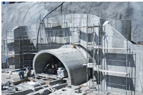
Slika 2. Završni radovi oko portala tunela Stupe

lektora s dvije cijevi promjera 1 200 mm, slobodni profil za prolaz vozila za održavanje gabarita 2,5 \times 2,2 m iznad betonskog kolnika, prostor za smještaj vodovodnih cijevi promjera 700 mm i hidrantske mreže promjera 150 mm na desnoj strani tunela, prostor za smještaj električnih, telefonskih i ostalih vodova na lijevoj strani tunela te prostor za smještaj električne rasvjete u kaloti tunela. Uzdužni je nagib tunela 1 ‰.