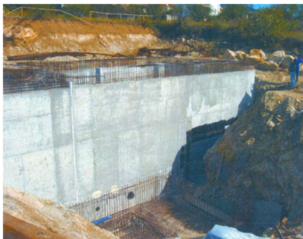
Slika 7. Radovi na vodospremi CS Solin i podsustavu Sv. Kajo

Za prolaz cjevovoda ispod prometnice ("stara magistrala") bilo je potrebno zatvoriti promet cestom, a zbog važnosti prometnice izvedba se morala dovršiti u najkraćem mogućem roku. Cijeli je posao obavljen, unatoč nepovoljnim vremenskim uvjetima, danonoćnim radom u 4 dana tako da su nakon iskopa na pripremljenu podlogu postavljena dva montažna armiranobetonska elementa dimenzija 2,10 \times 2,50 \times 5,15 m.