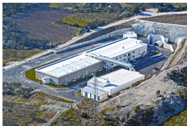
Slika 4. Zgrade uređaja za pročišćavanje otpadnih voda Stupe

Uređaj za pročišćavanje otpadnih voda Stupe (UPOV) središnja je građevina kanalizacijskog sustava Split-Solin. Do njega se transportiraju sve prikupljene otpadne vode iz pripadajućeg slijeva i na njemu se pročišćavaju prije ispuštanja kroz podmorski ispust u more.