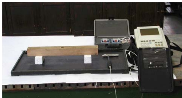
Slika 2. Ultrazvučno mjerenje MOE u