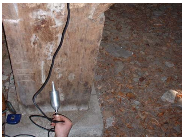
Slika 3. Ultrazvučni instrument Sylvaduo test s ugrađenim elementima