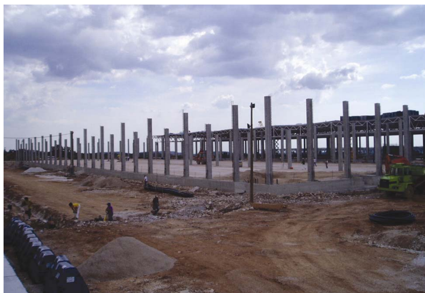
Gradilište u prvoj fazi izvedbe hala