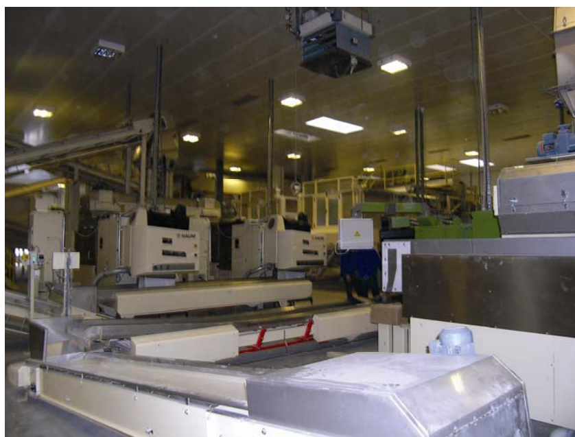
Unutrašnjost jedne hale sa strojevima

pe, a da su glavni isporučitelji opreme najpoznatiji svjetski proizvođači opreme za duhansku industriju: Comas , Garbuio i GD iz Italije te Hauni iz Njemačke, a manjim je dijelom zastupljena i Zlatorog oprema iz Slovenije. Prema vrijednosti najviše je za opremu plaćeno GD -u, a prema volumenu najviše je opreme isporučio Comas . Tehnologija inače u cijeloj investiciji sudjeluje s otprilike 10 posto. Radi se o dvije zasebne tehnološke cjeline – pripremi duhana ( Comas i Garbuio ) te izradi i pakiranju cigareta ( Hauni i GD ). I u rovinjskoj tvornici postoji suvremena tehnologija (dobavljena od 1992.