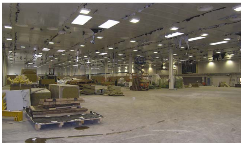
Montaža strojeva i opreme

Osim suvremenih tehnoloških linija imaju vlastitu kotlovnicu (s ekološki povoljnim ekstra lakim loživim uljem), kompresorsku stanicu, postrojenja za kondicioniranje zraka i za pročišćavanje otpadnog zraka te brojne radionice i laboratorije.