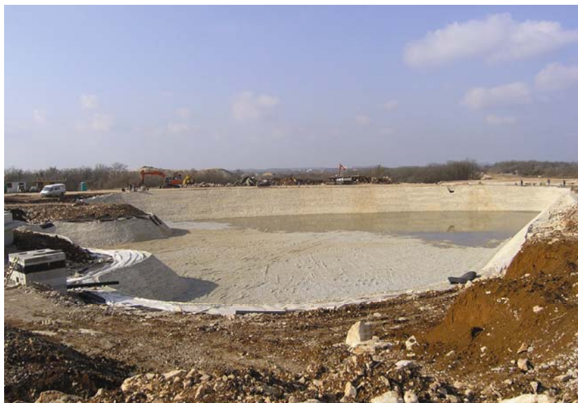
Izgradnja jezera na zapadnom rubu gradilišta

Na jugu je izdvojeno veće parkiralište za zaposlene, a manje je parkiralište za posjetitelje predviđeno u blizini upravne zgrade. Kapacitet parkirališta za zaposlene i posjetitelje određen je na 285 parkirališnih mjesta, od čega 15 za invalide. Broj je određen na temelju najvećeg broja zaposlenih (400) i procijenjenog broja posjetitelja (12). Određen je ipak