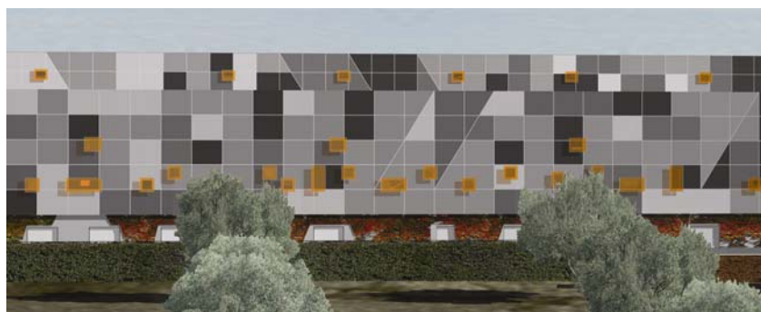
Izgled pročelja tvorničkih hala

Istočna hala (H1) ima tlocrtno dimenzije 49,5 x 169,5 m, a sastoji od jedne etaže. Proizvodna hala u sredini (H2) ima dimenzije 168,5 x 55,5 m, a sastoji od dvije etaže i galerije. Prva je predviđena za skladište reprodromaterijala i skladište gotove robe, a na drugoj će biti priprema duhana dok na galeriji istraživanje i razvoj te klima komore. Na tu su halu vezana vanjska skladišta koja se nalaze u sklopu potpornih zidova. Na tom će mjestu biti spremišta lako zapaljivih tvari i tekućina, otpadnih ulja i zapaljivih plinova te stanica za gašenje požara pjenom. Proizvodna hala prema zapadu (H3) ima iste dimenzije (168,5 x 55,5 m) i broj etaža kao hala H2. U prvoj etaži se predviđa energetika i opće održavanje na drugoj će biti izrada i pakiranje, a na galeriji klima komore.