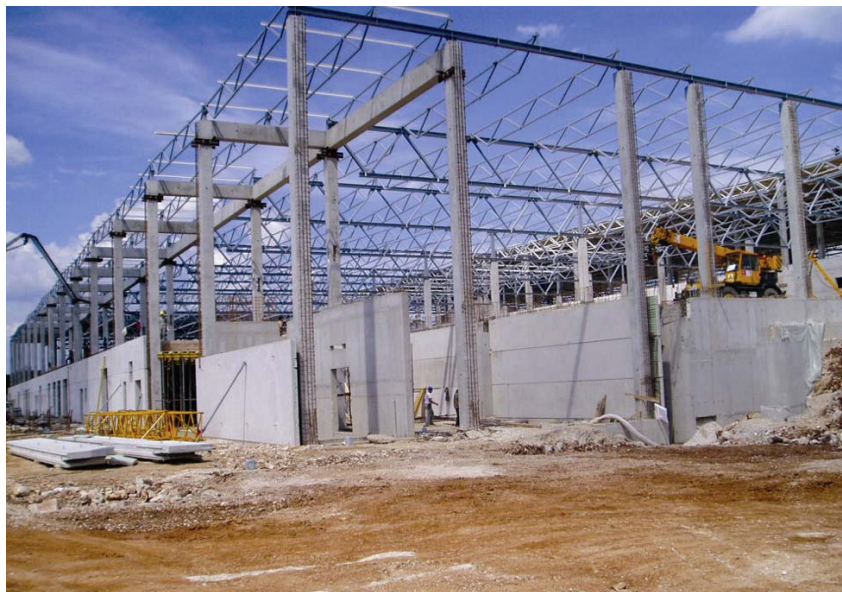
Ugradnja montažnih armiranobetonskih ploča na pročelju

Osnovni nosivi sustav proizvodnih hala čine montažni armiranobetonski konzolni stupovi sa pročeljnim zidovima upetim u čaške temeljnih stopa. Stupovi su dimenzija 50 x 50 cm na rasteru 12 x 24 m koji nose čeličnu konstrukciju krova. Raster stupova na fasadi je 6,0 m. U proizvodnoj hali (H2) raster stupova unutar tlocrta koji nosi gljivasti strop je 12 x 8 m. Pročeljni se zidovi izvode polumontažno sustavom predgotovljenih armiranobetonskih sendvič panela koji se na gradilištu monolitno spajaju u cjelovit sustav i povezuju sa stupovima na koji se u konačnici vješa završna obloga fasade. Predgotovljeni fasadni paneli su dimenzija 3,0 x 2,45 m.