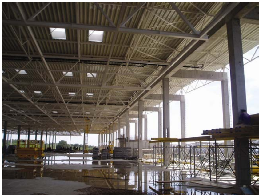
Pogled na montiranu čeličnu konstrukciju i pokrov

Podne ploče su debljine 20 cm armirane čeličnim vlaknima i leže na uvaljanom i zbijenom kamenom nasipu modula zbijenosti 80 Mpa. Ploče su dilatirane prošlicanim fugama u poljima 6,0 x 8,0 m s obradom površine za premaz industrijskim podom.