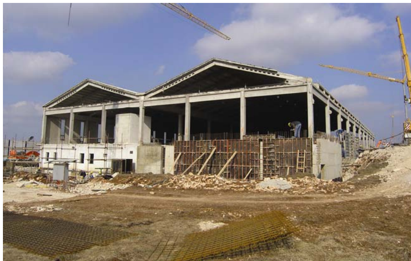
Radovi na preuređenju i dogradnji Istragrafike

Središnje je skladište u prizemlju povezano sa suterenom unutarnjim dvokrakim betonskim stubištem uz sjeverno pročelje te unutrašnjim hidrauličkim teretnim dizalom uz južno pročelje. U suterenu se uz skladište nalazila manja mehanička radionica.