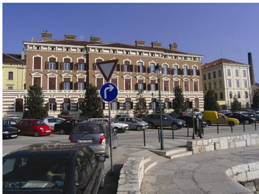
Upravna zgrada TDR-a i Adris grupe u Rovinju

Nakon što su propale sve inicijative, na kraju se Adris grupa opredijelila za restrukturiranje vlastite proizvodnje i gradnju nove suvremene tvornice u Kanfanaru. To je na određen način