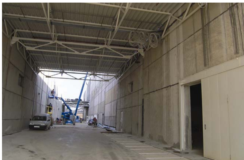
Topla veza između hala

koordinira i poslove ostalih brojnih izvođača i montažera. Svakoga je dana na gradilištu više od petsto radnika, a bilo je dana kao ih je bilo i više od 600.