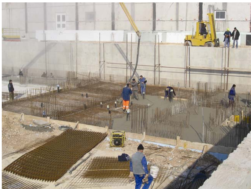
Početak gradnje upravne zgrade

Nosivu konstrukciju u suterenu čine armiranobetonski stupovi između kojih su armiranobetonski zidovi debljine 30 cm, a raster je stupova isti kao u prizemlju. Uz obodne stupove izvedena su dva reda unutarnjih stupova koji nose armiranobetonsku gljivastu stropnu ploču debljine 40 cm, koja je izvedena s kapitelima.