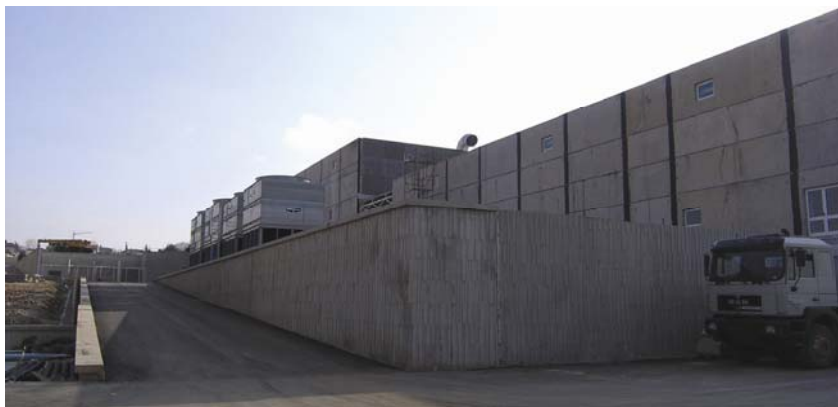
Gradilište snimljeno sa sjeverozapada

Nadzorni je inženjer vrlo zadovoljan dosad obavljenim radovima, a posebno je zadovoljan s Tehnikom koja osim grubih građevinskih radova