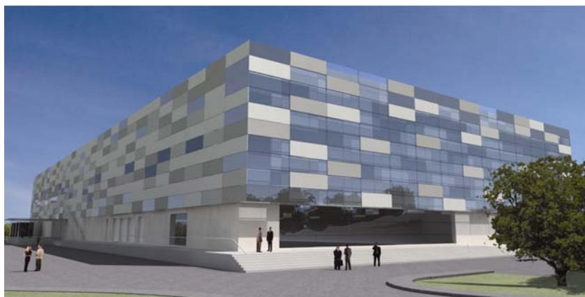
Budući izgled tvornice ambalaže Istragrafika