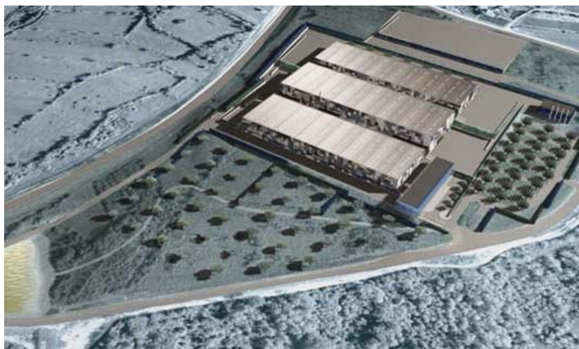
Trodimenzijski prikaz kompleksa nove tvornice

Središnja je cjelina toplim vezama povezana građevina proizvodnih hala. Njezine su dimenzije 169,5 x 181,5 m, pa joj je tlocrtna ploština, koja uključuje i vatrogasne koridore – 30.764,25 m.