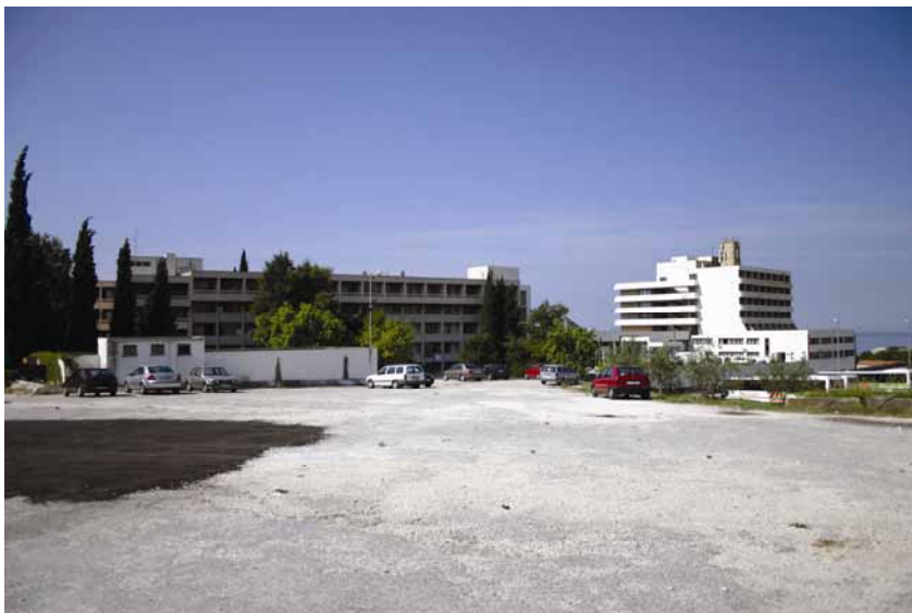
Hotel Zagreb-Duilovo je u neposrednoj blizini

Prostor između uvale Zente i Duilova još šezdesetih godina prošloga stoljeća osmišljen u sklopu megaprojekta Split 3. To područje trebalo je biti izlaz na more stanovnicima novih stambenih naselja koji bi se