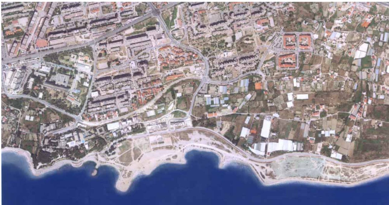
Pogled na Žnjan iz zraka

torno-planske dokumentacije, a u ovom se slučaju jedan pomalo arhaičan plan (GUP iz 1978.) stihijski mijenjao i dopunjavao prema trenutnim potrebama i zahtjevima. Tijekom devedesetih godina došlo je nažalost do učestalih točkastih izmjena, najčešće bez ikakvog smisla i