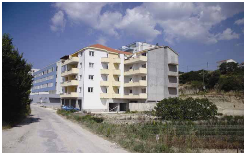
Novogradnja u blizini vrtova