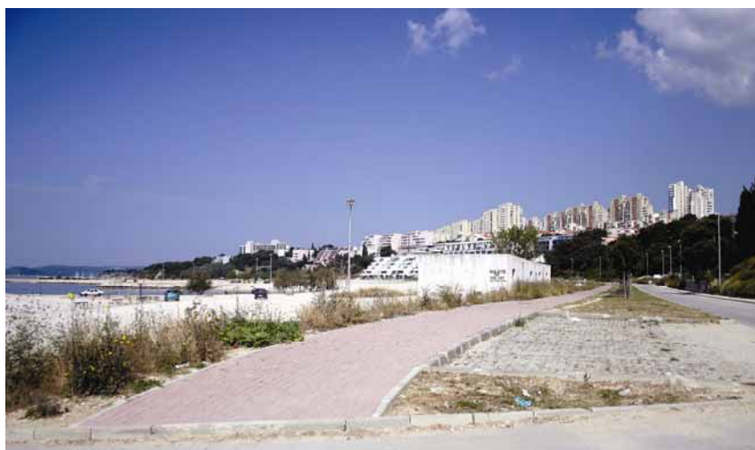
Pogled na Žnjan i okolne zgrade