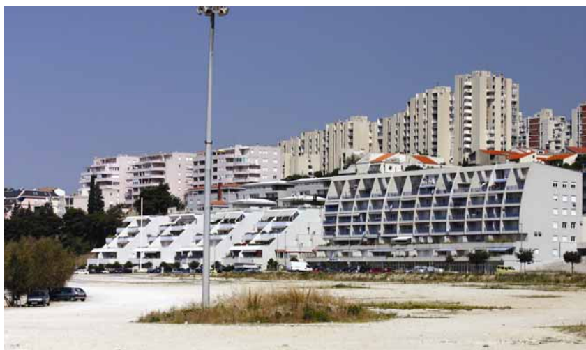
Zgrada najbliža obali

odlukom donošenja DPU-a prije donošenja novoga GUP-a, čak i donošenja mogućih dopuna, Gradskom je poglavarstvu ostavljena je mogućnost, odnosno preciznije rečeno tadašnjoj političkoj strukturi, planerima i neposrednim korisnicima, da prostor osmišljavaju prema vlastitim željama, a ne prema značaju koji bi takav