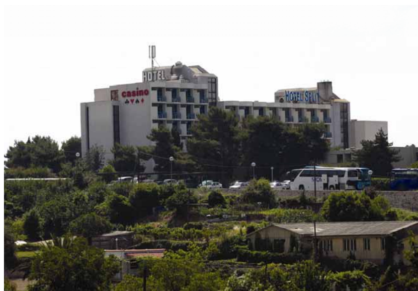
Hotel Split je u sastavu Žnjana

njem je novoga GUP-a napravljen ipak kvalitetan korak naprijed. Prostor je sada kvalitetnije osmišljen i isplaniran, ali s nedostacima koji su morali "zacementirati" neka zateče-