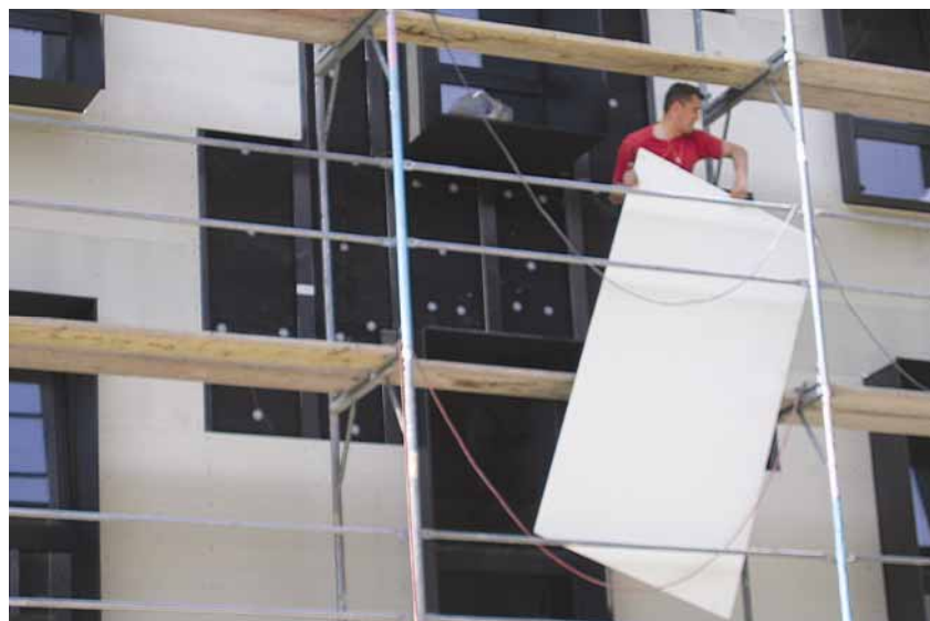
Montaža Verotec ploča

jesen 2002. Izgrađeni je krov garaže postao nova pješačka okosnica koja se širi na postojeće gradsko pješačko središte i pruža prema sjeveru. Nova je pješačka prometnica smještena u središtu i izlazi od Dolca prema ulici Pomerio, a na bokovima su joj građevine podijeljene u osam zasebnih jedinica s četiri ili pet katova. Prva tri kata zauzimaju uredi, a ostale stanovi. Stanovima se prilazi s posebne privatne dvorišne ulice na četvrtom katu. Svi su organizirani kao dvokatne posebne cjeline s vlastitim terasama; ima 20 stanova s ploštinom od približno 160 m 2 , što je ukupno 2943 m 2 . Prizemlje s trgovinama zauzima 3304 m 2 , a uredi 8720 m 2 . Ukupna