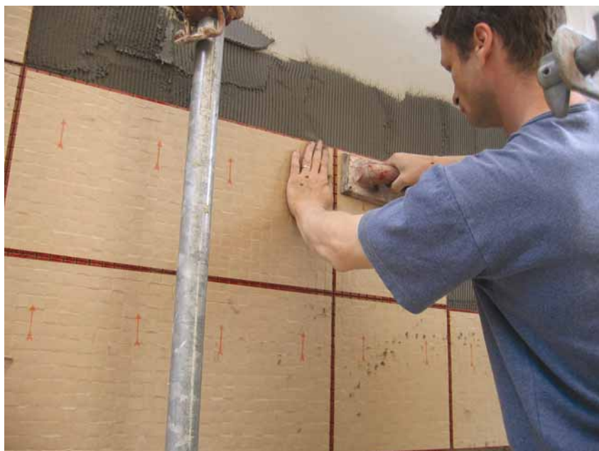
Nanošenje staklenog mozaika

za suvremena pročelja s najvećom uštedom toplinske energije. Na STO Verotec ploče mogu se nanositi čak i keramičke ploče velikih formata.