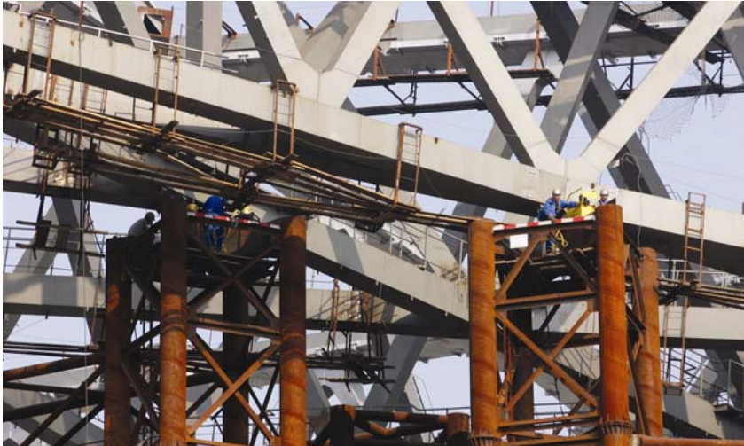
Radovi na uklanjanju privremenih podupora

lovanjem. U središnjem se računalu svi podaci o opterećenosti i zamasi- ma preračunavaju zbog potpuno kontroliranog procesa podizanja i spuštanja. Tijekom procesa spušta- nja "ptičje je gnijezdo" alternativno bilo pridržavano hidrauličkim cilin- drima i pločama za niveliranje na privremenim pridrživačima.