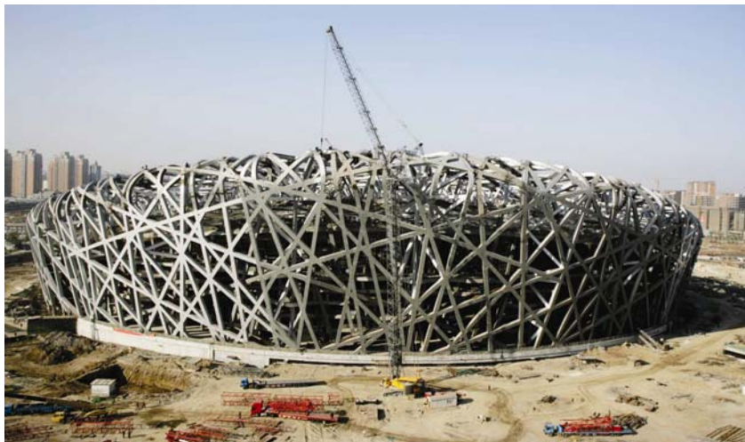
Konstrukcija isprepletenih i iskrizanih 45000 t čelika pri kraju izgradnje

no unatoč tome jednostavan i starinski neposredan, stvarajući jedinstve-