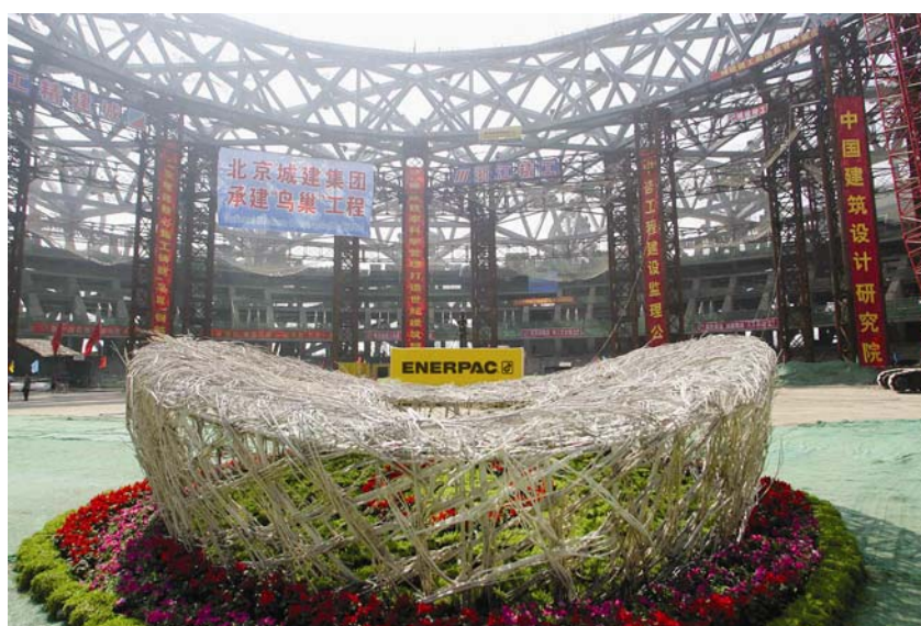
Maketa stadiona ispred građevine na kojoj se vide privremene podupore

na sinkronizirano i potpuno kontrolirano podizanje konstrukcije iz njezinih podupirača, rezanja varova te kontrolirano i sinkronizirano spuštanje skelom koja dopušta micanje 50 mm tanke ploče za niveliranje koja se rabila tijekom izgradnje. Za ovaj je posao upotrijebljena hidraulika kontrolirana računalom. Cijelu konfiguraciju, koja uključuje središnje računalo, kontrolore satelitskog računala, 156 hidrauličkih cilindara visokog pritiska s dvostrukim djelovanjem i 55 elektronički kontroliranih hidrauličkih energetske jedinice, osmislio je Enerpac . Za dodatnu