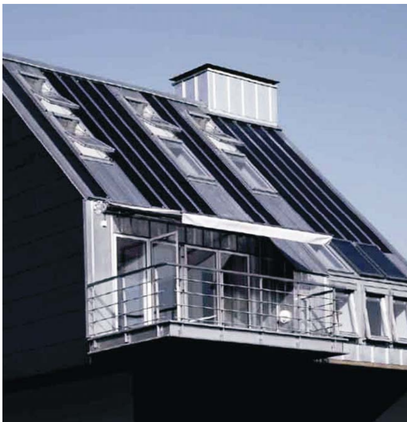
Stambena jedinica Soltag

dan. Projekt je stvoren u suradnji gradskih planera, graditelja i stručnjaka za energiju i dnevnu svjetlost koji je osim za nadogradnje na pos-