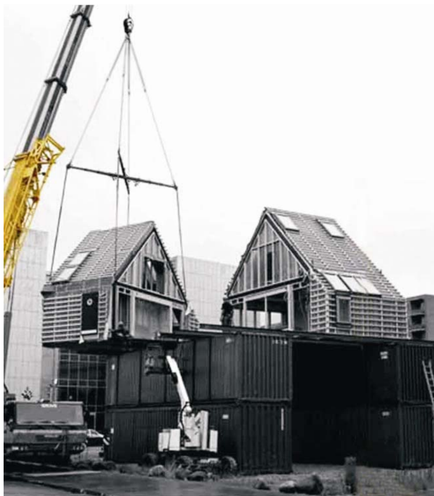
Postavljanje stambene jedinice na postojeću građevinu

solarnih ćelija može se postići potrošnja energije od 0 kWh/m 2 za grijanje. Bit projekta je u balansiranju između upijanja energije, kapaciteta izolacije i izmjene zraka. Kuća je energetska stanica koju odlikuje funkcionalnost i zdrava klima unutar