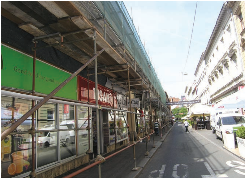
Skele oko Omladinskog centra u Teslinoj ulici