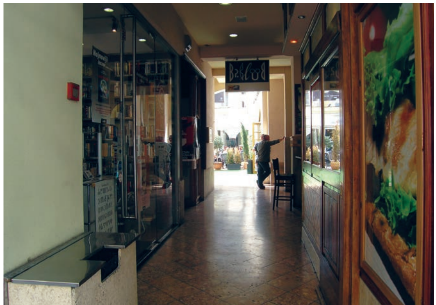
Glavni prolaz u unutrašnje dvorište

U reportaži je, nažalost, gotovo prešućena jedna ključna osoba cijelog pothvata – tajnica ondašnjeg USIZ-a za društvenu brigu o djeci predškolskog uzrasta koja je energično koordinirala i rukovođila cijelom investicijom. To su uostalom priznavali i svi sudionici građenja, a zabilježeno je i u tekstu, doduše bez imena