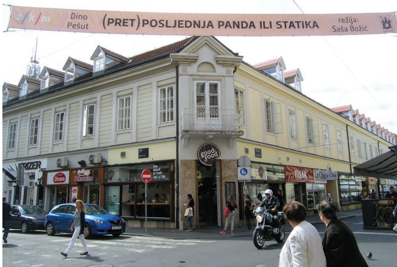
Uglovnica Tesline i Gajeve ulice oslobođena skela

Nedavno smo izvana obišli prostorije Omladinskog centra i zanimljivo je da smo tom prilikom zatekli skele i u Gajevoj i u Teslinjoj ulici. Naime, uređivala su se ulična pročelja, a to je i razumljivo jer je od izgradnje prošlo gotovo 30 godina. No i u usputnoj je šetnji cijelim prostorom uočeno vrlo malo mladih, a to nam je potvrdilo sumnju da je Omladinski centar bio generacijsko okupljalište te da se današnja mladež okuplja negdje drugdje. No ne može se osporiti činjenica da je cijeli kompleks u središtu Zagreba bio i ostao vrlo uspješan te da je puno značio i znači kao mjesto za kulturna i druga javna druženja.