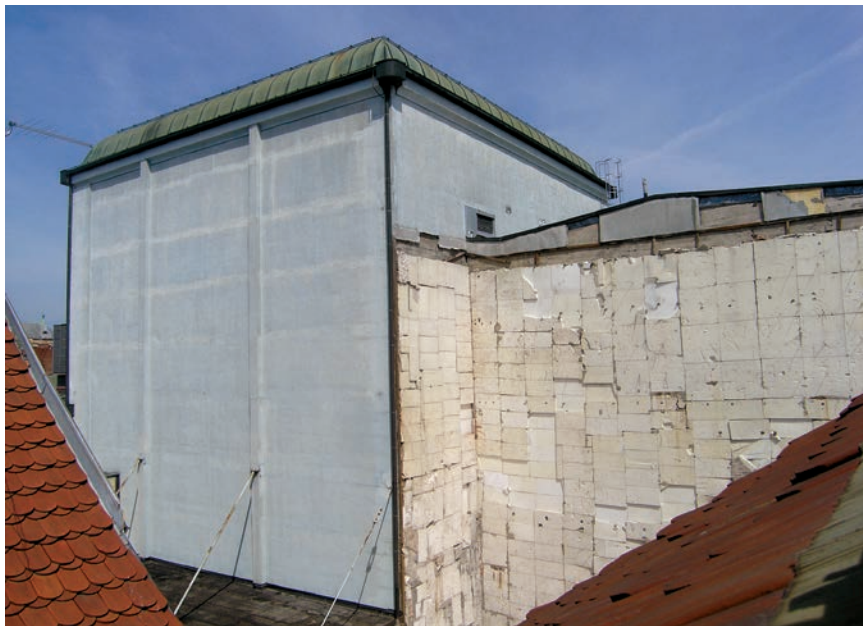
Dio kompleksa snimljen iz zgrade Hrvatskoga inženjerskog saveza

tadašnjeg obilaska bila u tijeku prva faza radova, u kojoj je bila predviđena gradnja kompletnoga Zagrebačkog kazališta mladih s pomoćnom pozornicom, ali trebali su biti dovršeni i tribina, garderoba i ostali sadržaji.