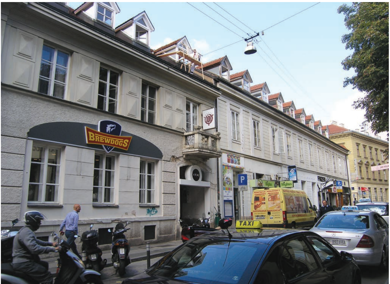
Uređeno pročelje Omladinskog centra u Gajevoj ulici

U kompleksu omeđenom Teslinom i Gajevoj ulicom stalno djeluje i bivši Omladinski radio koji od 1990. nosi naziv Radio 101 (prema frekvenciji na kojoj je emitirao). Stojedinica je dugo bila najpopularniji i najslušaniji radio u Zagrebu i u većem dijelu Hrvatske, ali i mjesto gdje su svoju karijeru započeli mnogi današnji poznati novinari. Radio je 2011. bio u stečaju, a sada je u vlasništvu Nijemca Thomasa Alexandra Thimmea. U prostoru centra postoje i dvorane za predavanja i manji izložbeni prostori te više trgovina i knjižara. Tako su se povremeno održavali manji rock koncerti, a u podrumskim je prostorijama često nastupao i legendarni jazz glazbenik Boško Petrović (1935. – 2011.). Nalaze se tamo i razni ugostiteljski objekti u zatvorenom i na otvorenom prostoru, a sendviči na ulazu iz Tesline ulice uvijek su bili najpopularniji među mladima.