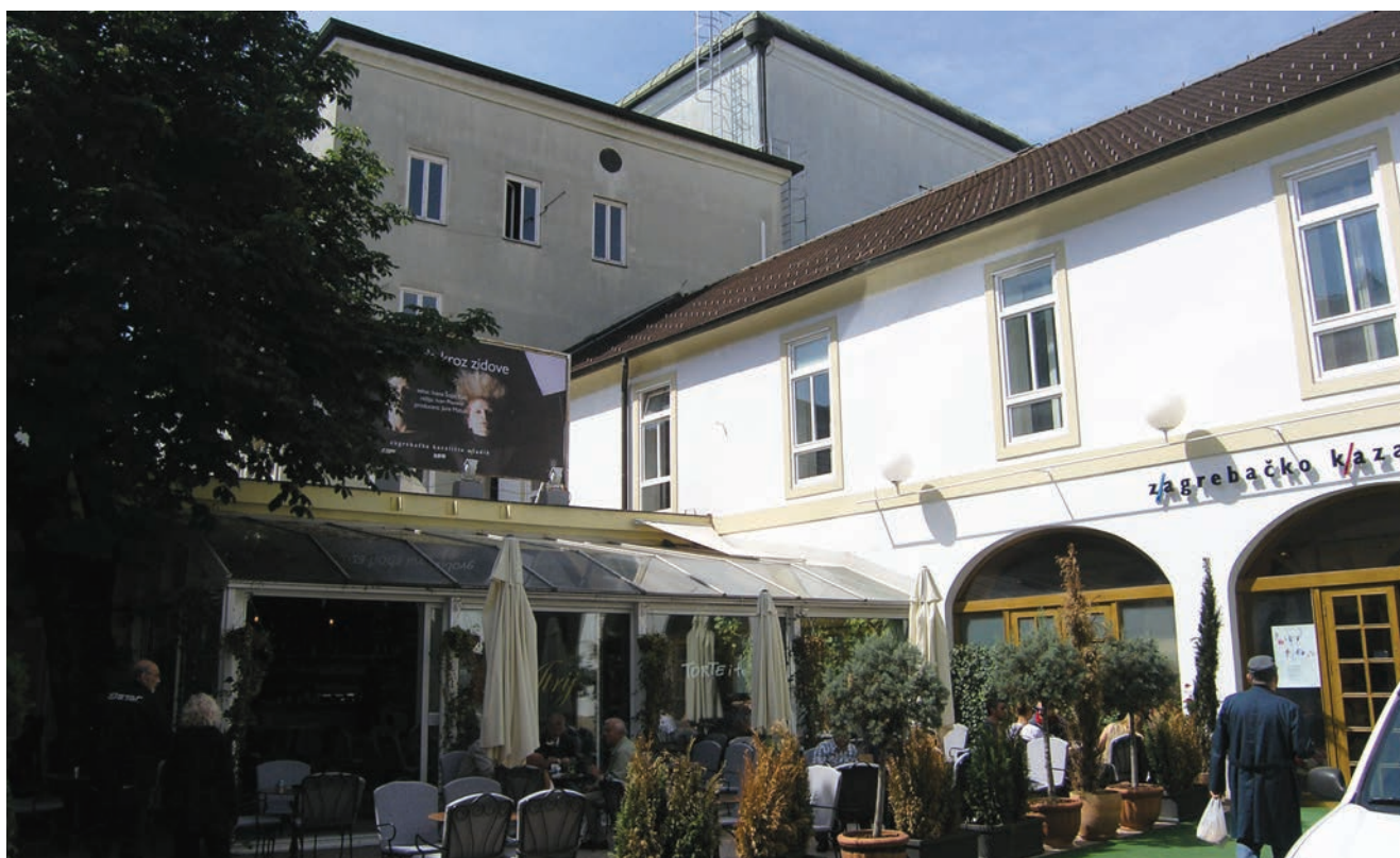
Ulaz ZKM i kafić u dvorištu