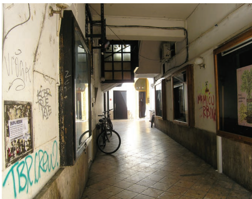
Ulaz u Omladinski centar iz Gajeve ulice

stava i koprodukcijских projekata kojima pomiče granice suvremene scenske umjetnosti, a dobitnik je i brojnih nagrada u zemlji i inozemstvu.