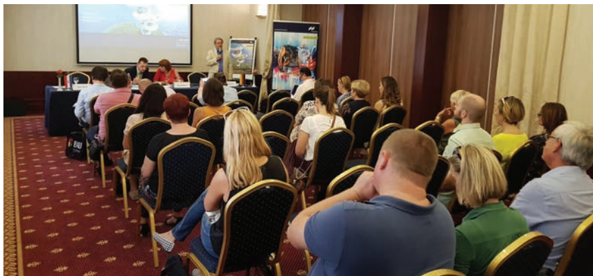
Prezentacija sajma BAU u hotelu Palace

zemalja, a sličan broj posjetitelja bio je iz Ujedinjenog Kraljevstva, Francuske i Španjolske. Približno 40 posto izlagača na BAU-u je iz inozemstva, što je povećanje od šest posto u odnosu na 2017. godinu.