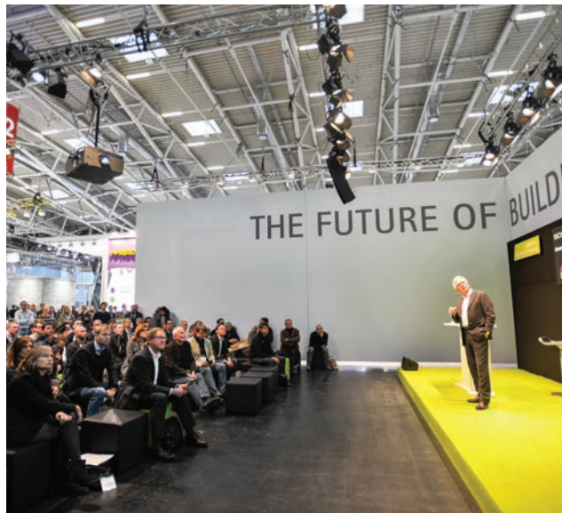
Detalj s predavanja održanog u okviru jednog od brojnih Foruma

i bogat prateći program koji se sastoji od foruma i posebnih prezentacija, uključujući: