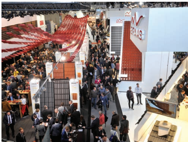
Pogled na jedan od izložbenih paviljona

Osim izložbenog, sajam BAU 2019., baš kao i njegova prethodna izdanja, imat će