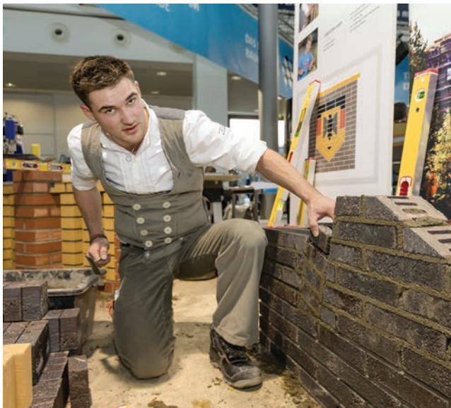
Prezentacija u okviru Kampa za obuku