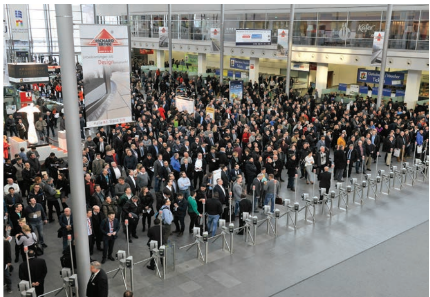
Gužva na ulazu na sajamsku priredbu održanu 2017. godine