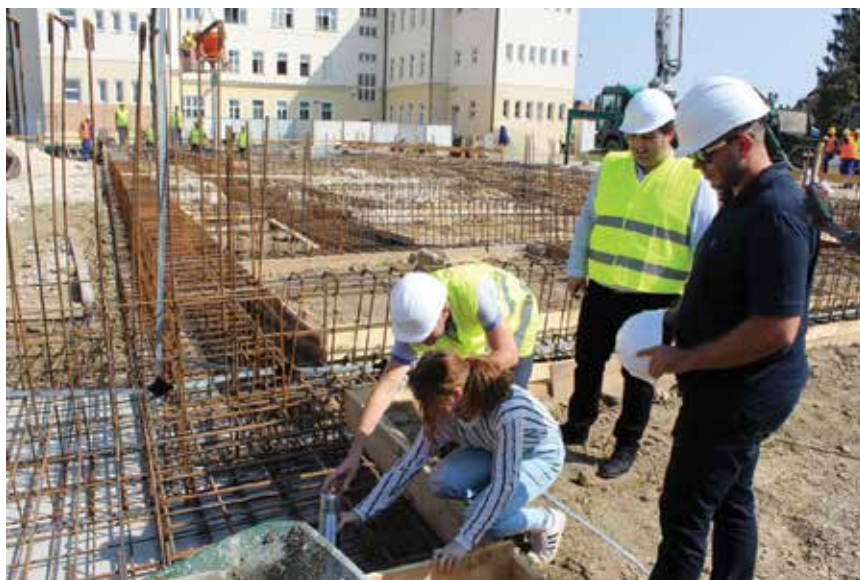
Polaganje vremenske kapsule u temelje nove dvorane

lukove na tlu (ukupno 23 luka), a potom su se lukovi uz pomoć kрана podizali i montirali na armiranobetonsku konstrukciju te međusobno povezivali u cjelinu odnosno u lučni krov dvorane. Pritom je korištena mehanizacija standardna za građevinske radove kao što su toranjska dizalica s rukom duljine 60 metara te autodizalica nosivosti 150 t,