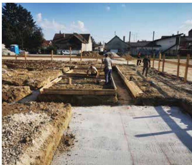
Detalj s gradilišta tijekom izvedbe temelja dvorane

gradit će se kao jednoetažna zgrada od modernih i čvrstih građevnih materijala. Građevina se sastoji od triju dijelova površine 1440 kvadratnih metara, dok je aneks uz dvoranu površine približno 1000 m 2 , a sastoji se od tehničke prostorije (kotlovnice), nove kuhinje, blagovaonice, sanitarnih prostora, knjižnice, kabineta za nastavnike i slačionice. Aneks čine zidovi zidani opekam i ojačani armiranobetonskim serklažima. Krov iznad aneksa ravan je i ima završne slojeve za ravne krovove.