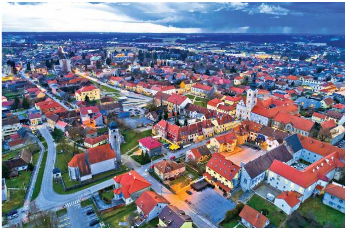
Križevci snimljeni iz zračne perspektive

Na početku treba istaknuti jednu zanimljivost o nazivu toga starog hrvatskog grada u Prigorju, koji se prvi put spominje 1209. Naziv Križevci je u množini jer je današnji grad nastao spajanjem dvaju gradova: Donjeg i Gornjeg grada. Grad je i poznato željezničko i cestovno prometno čvorište pa je možda i to pridonijelo današnjemu nazivu. To je mjesto u kojemu se stvarala i branila hrvatska državnost, u kojemu su izdane mnoge važne isprave i u kojemu je bilo održano 27 hrvatskih sabora, među kojima je najpoznatiji Krvavi sabor križevački. Stoljećima je bio administrativno središte i jedan od najvažnijih gradova Središnje Hrvatske. Kraljevsko gospodarsko i šumarsko učilište