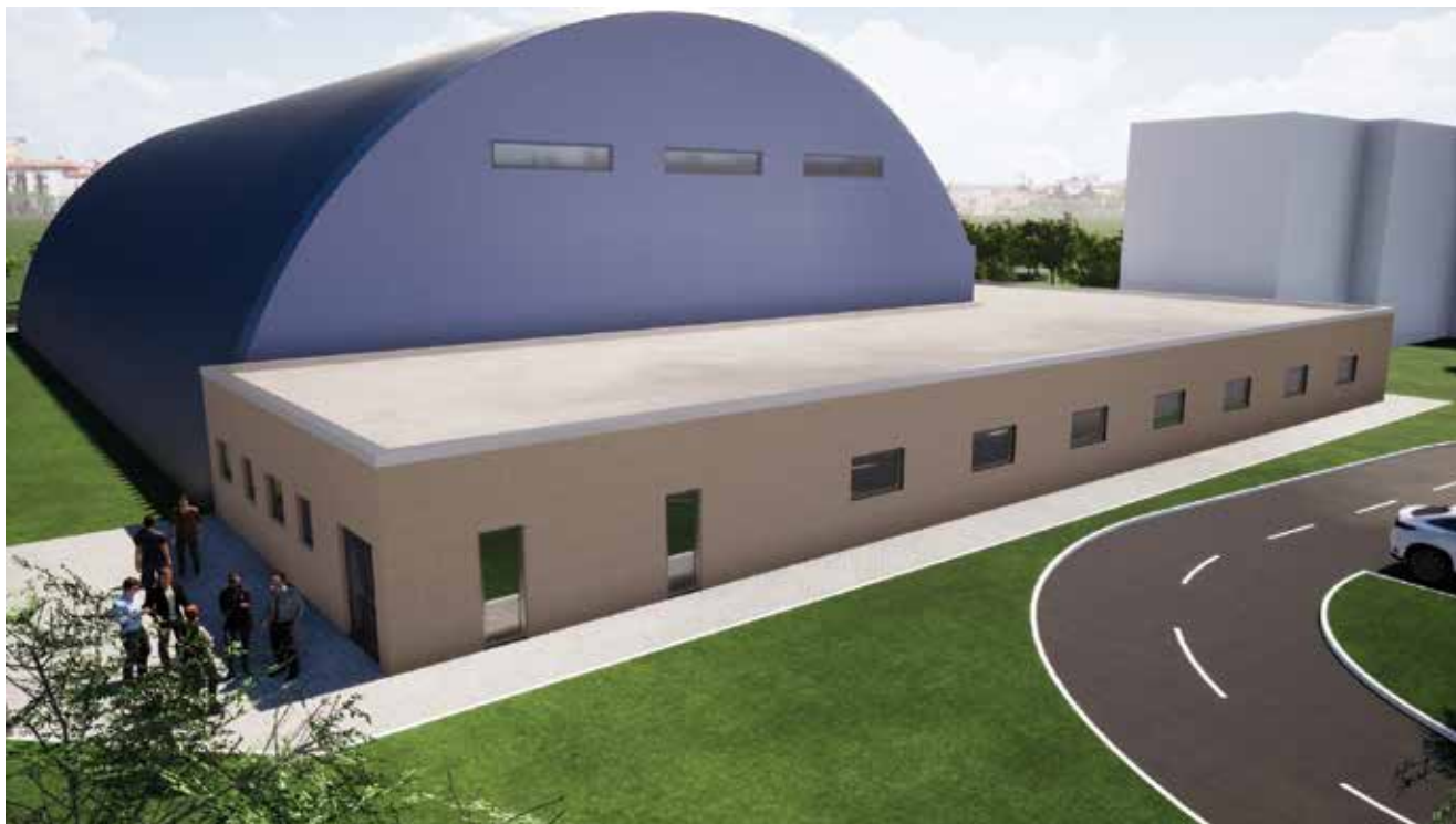
Vizualizacija aneksa koji se gradi uz sportsku dvoranu

Radovi na terenu počeli su 5. kolovoza 2020. rušenjem postojećih građevina na građevnome zemljištu, a nakon zemljanih radova, izvedeni su temelji nove građevine. U temelje nove dvorane Osnovne škole Ljudevita Modeca simbolično je položena vremenska kapsula, koju su pripremili učenici s profesoricom Martinom Valec-Rebić. Kapsula sadrži predmete namijenjene budućim nalaznicima kapsule kako bi mogli steći uvid u razdoblje u kojem je dvorana građena, probleme s kojima se učenici suočavaju, ali i uspjehe koje su postigli. U kapsuli su pohranjene i informacije o školi, učenički literarni i likovni radovi te medicinska maska kao obilježje razdoblja pandemije koje je svim djelatnicima škole značajno promijenilo svakodnevnicu.