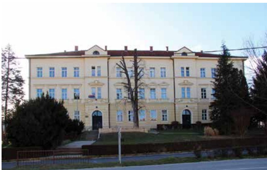
Osnovna škola Ljudevita Modeca

Nova investicija ne rješava isključivo pitanje nastave tjelesne i zdravstvene kulture u Osnovnoj školi Ljudevita Modeca, već je riječ o dvorani koja je preduvjet za prelazak na jednosmjensku nastavu i puno kvalitetniji život učenika jer će se otvoriti niz termina koji će u popodnevnim satima i vikendom biti na raspolaga-