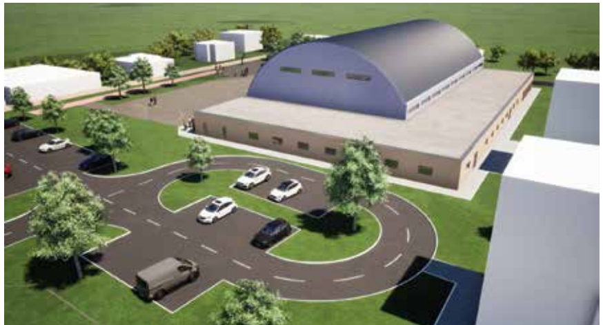
Vizualizacija nove sportske dvorane

Godine 1779. u Križevcima je otvorena Narodna škola, a nastava se održavala u gradskoj vijećnici te po privatnim kućama. Bila je to četvororazredna škola, s time što je završni razred bio pripremi za gimnaziju i u njemu se učio latinski. Godine 1855. sazidana je nova zgrada i u njoj učionica, a 1856. sagrađena je i školska knjižnica. Na uporne zahtjeve učitelja, a na temelju odluke gradskih zastupnika, godine 1869. otvorena je četvororazredna djevojačka škola. Škola je 1875. dobila službeni naziv "Obća pučka škola", a godinu dana poslije bila je održana i prva učiteljska skupština križevačkoga i koprivničkoga kraja. Na temelju odluke križevačkoga gradskog poglavarstva 25. srpnja 1900. počela je gradnja nove školske zgrade koja je na upotrebu bila predana 9. rujna 1901. U istoj toj zgradi osnovna škola djeluje i danas, a u njoj nastavu pohađa približno 880 učenika.