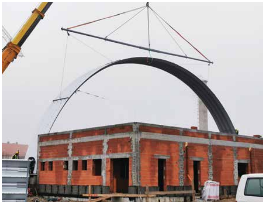
Postavljanje lučne konstrukcije krova

kojom su dijelovi čeličnih lukova bili podizani na krov zgrade.