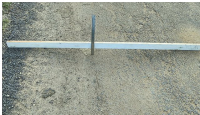
Slika 6. Kolotrazi na površini ceste u lipnju 2017.

Prikazane su i vrijednosti kolotražnja za preostale ceste. Iz tablice 6. može se zaključiti da je stvarna vrijednost kolotražnja puno bliža vrijednosti dobivenoj iz modela, što pokazuje da je pouzdanost modela razvijenog u ovom radu prihvatljiva.