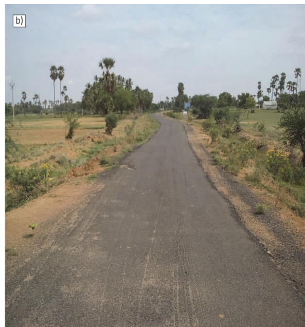
Slika 2. a) i b) Fotografija dijela ceste