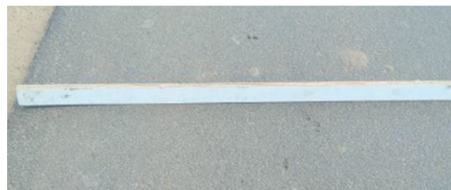
Slika 5. Novoizgrađena cesta u siječnju 2015.

Za provjeru točnosti referentnih podataka za ceste s malim volumenom prometa, vrijednosti kolotražnja na 15 cesta ručno su izmjerene na terenu; početna vrijednost kolotražnja bila je 0,00 mm. U razvijeni model kolotražnja uključene su informacije o vrijednostima starosti, MSN-a i CVPD-a za odabrane ceste, kao što je prikazano u tablici 6. Na primjer, cesta Pinjivakkam izgrađena je u siječnju 2015.; izmjerena vrijednost kolotražnja bila je 3,6 mm, a predviđena vrijednost kolotražnja krajem lipnja 2017. bila je 3,81. Kao što je prikazano na slikama 5. i 6., vrijednosti kolotražnja izmjerene su na istoj cesti, točnije u vrijeme izgradnje i pri određenoj starosti.