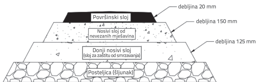
Slika 3. Poprečni presjek kolničke konstrukcije ceste malog volumena prometa

Kolnik je projektiran da podnese opterećenje jednog kotača od 5100 kg s ukupnom debljinom kolničke konstrukcije od 295 mm. Seoske ceste s malim volumenom prometa izgrađene su u tri glavna sloja preko sloja posteljice od šljunka. Prvi nosivi sloj probne dionice u ovom radu izgrađen je od mješavine šljunka