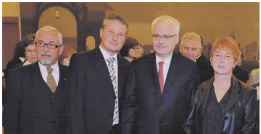
Na primanju kod Ive Josipovića