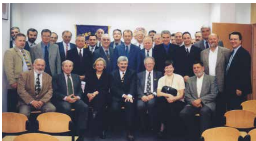
Zajednička fotografija s kolegama iz Ingri

Bio je istaknuti član Društva građevinskih inženjera i tehničara Međimurje, a obnašao je i dužnosti njegova predsjednika i