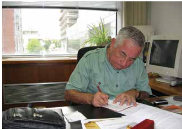
Za radnim stolom u Ingri

prostorima. Međimurje je postalo premleno za realizaciju sve ambicioznijih građevinskih projekata i upošljavanje organiziranih kapaciteta, kako materijalnih tako ljudskih. U želji da međimurški graditelji dobiju svoje zasluženno mjesto na tržištu, osvajali su se novi prostori, ponajprije na Jadranu.