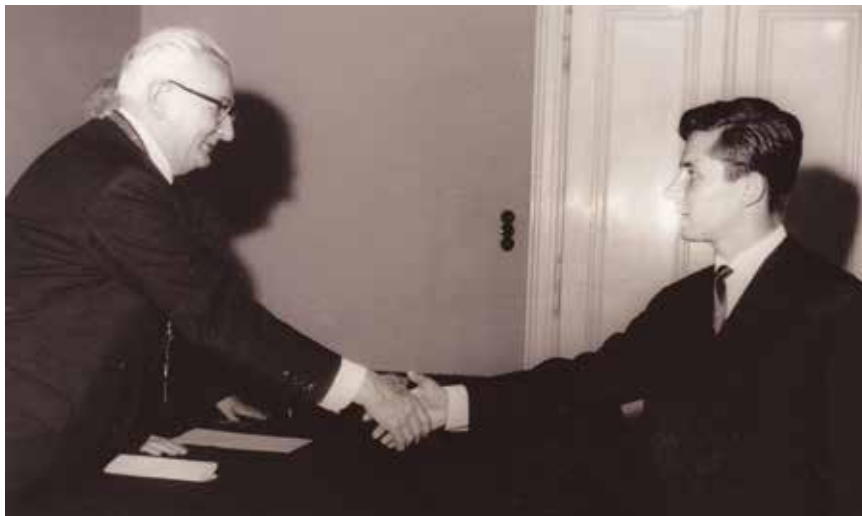
Svečanost dodjele diolome na Građevinskome odjelu Arhitektonsko-građevinsko-geodetskoga fakulteta u Zagrebu

Kao diplomirani inženjer građevinarstva svoj je radni vijek započeo 1962. predajući više predmeta u Građevinskoj tehničkoj školi u Čakovcu, na početku njezina osnivanja i djelovanja. Bio je razrednik prvoj generaciji ondašnjih maturanata, kasnije mnogih poznatih stručnjaka. Gotovo istodobno počeo je i pohod mladoga inženjera u građevinskoj operativi, ondašnjemu Građevnom kombinatu Međimurje , i to na gradilištima, u pogonu za proizvodnju prednapretnutoga betona i na poslovima građevinskoga konstruktora-statičara. Prošao je operativu od rukovoditelja gradilišta do tehničkoga direktora Kombinata. Svojom se stručnošću nametnuo ekipi kolega, okupivši mlade stručnjake koji su odredili koncept razvoja graditeljstva ne samo vlastite radne sredine, već i graditeljstva na ovim