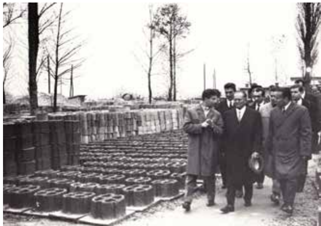
Obilazak proizvodnog pogona s Josipom Brozom Titom