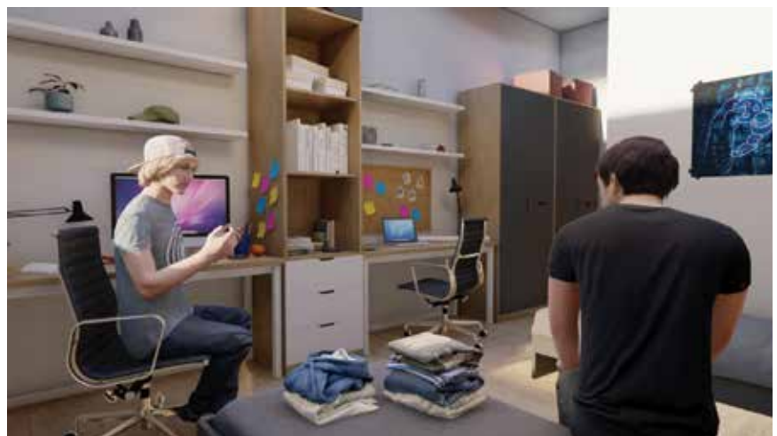
Vizualizacija sobe u studentskom domu

Glavni projekt Centra gaming industrije izradila je tvrtka Trames d.o.o. , a uključuje izgradnju nekoliko građevina na devet hektara zemljišta u Poduzetničkoj zoni Novska. Zgrada fakulteta prostirat će