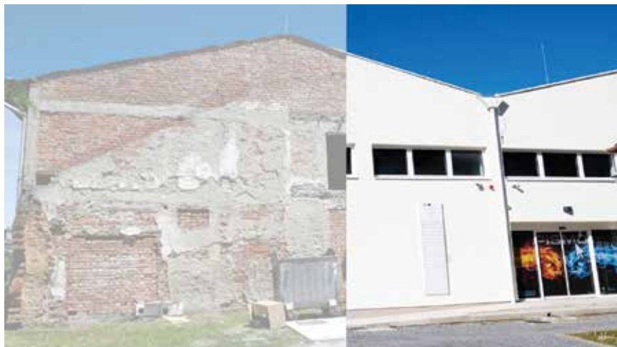
Fotografija zgrade PISMO 2, prije i nakon rekonstrukcije

kubator Sisačko-moslavačke županije. U sklopu toga projekta, koji se provodio od 2017. do 2020., obnovljene su dvije zgrade s ukupno 20 ureda, a taj prostor danas je opremljen videostudijem i glazbenim studijem, motion capture studijem, VR opremom, prostorom s CNC strojem, 3D printerom, mikroljevom, suradnim ( coworking ) prostorom i konferencijskom dvoranom. Poduzetnički inkubator Pismo svim svojim korisnicima omogućuje poslovanje uz smanjene troškove te