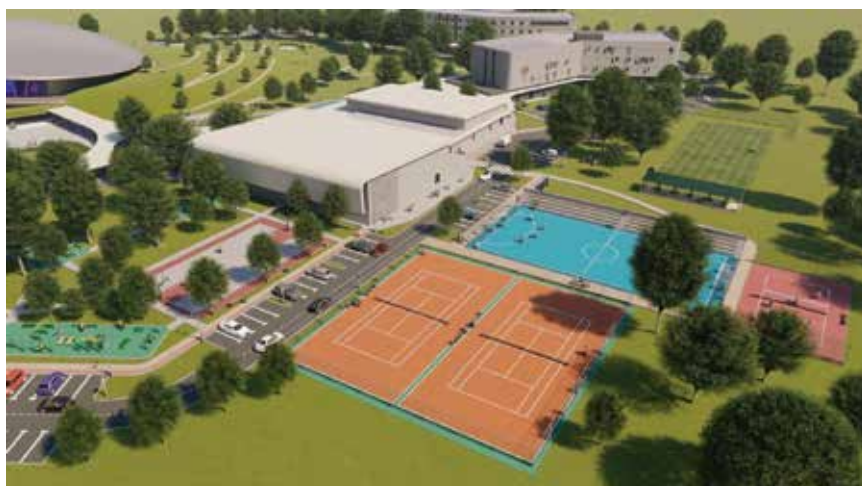
Kampus će sadržavati igrališta za različite sportove

Nedavno objavljena analiza industrije videoigara, u kojoj je analizirano 30 tvrtki koje zapošljavaju ukupno 522 radnika i vanjska suradnika u Hrvatskoj, pokazala je da su tvrtke u tome sektoru u 2021. ostvarile prihode oko 64,4 milijuna eura te da posljednje dvije godine bilježe dobit veću od 10 milijuna eura. U poduzetničkome inkubatoru u zadnjih šest godina osposobljeno je 240 game developer a, koji su kroz dva obrazovna programa dobili priliku steći znanja potrebna za izradu videoigara, od toga kako ih isprogramirati do toga kako izraditi 3D modele, odnosno grafiku za videoigre. Održano je 5760 sati edukacija te uspješno pokrenuto 67 startup tvrtki, koje u dvije obnovljene zgrade zapošljavaju više od stotinu