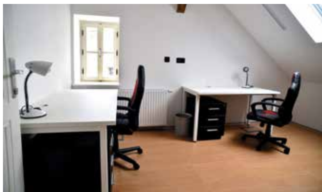
Novouređeni prostori Poduzetničkog inkubatora

Poduzetnički je inkubator u posljednjih šest godina utjecao na stvaranje kvalitetnoga poduzetničkog okruženja stvarajući prostor, pružajući usluge i omogućujući korištenje opreme kako bi poduzetnicima bilo lakše i dostupnije raditi na razvoju svojega poslovanja. Razvojem poslovanja i stvaranjem novih proizvoda i usluga bit će stvoreni uvjeti za otvaranje novih radnih mjesta, što u Sisačko-moslavačkoj županiji kao županiji s velikom stopom nezaposlenosti predstavlja potrebu i nužnost. Prednosti koje nudi Poduzetnički inkubator Pismo su najam ureda i konferencijskoga prostora po povoljnim uvjetima, najam opreme specijalizirane za industriju videoigara i metaluršku industriju, savjetodavne i mentorske usluge, edukacije i marketinška podrška.