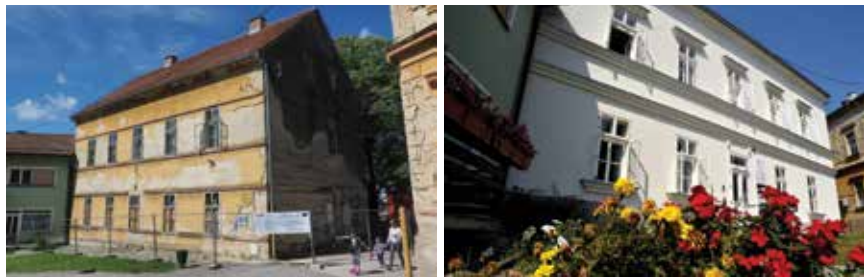
Onkubator PISMO 1 prije (lijevo) i poslije obnove (desno)