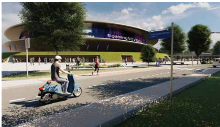
Gaming kampus će se prostirati na površini od devet hektara