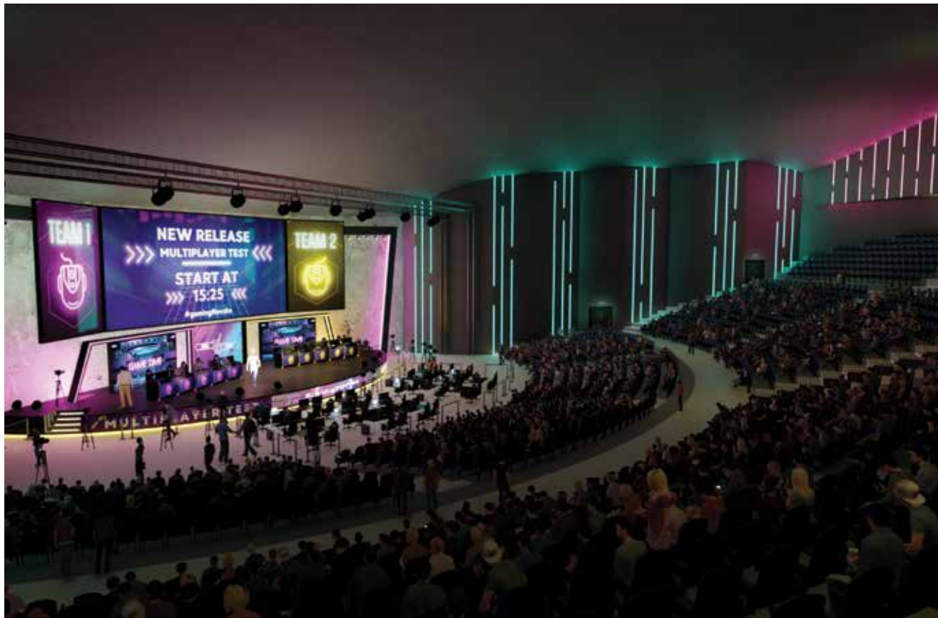
Arena za e-sport

se na 12 000 kvadratnih metara, a studentski dom na 5000 kvadratnih metara. U projekt je, uz sve studentske sadržaje poput restorana i ugostiteljskih objekata, uključena gradnja bazena te sportske dvorane. Studentski dom imat će 201 ležaj, a akcelerator 200 radnih jedinica i moderno opremljeni VR studio. Sve će