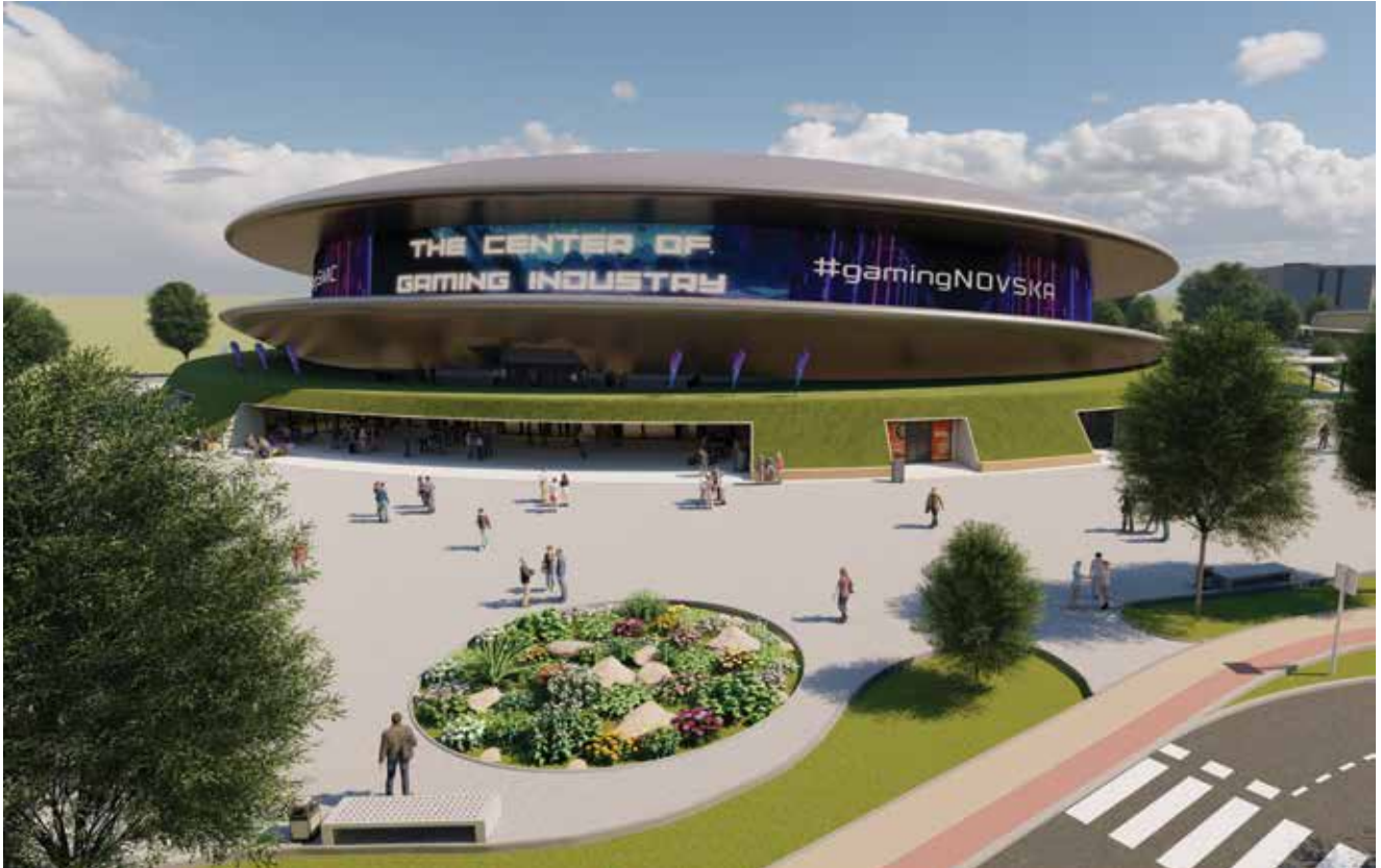
Vizualizacija glavne zgrade u Centru koja podsjeća na prizemljeni NLO