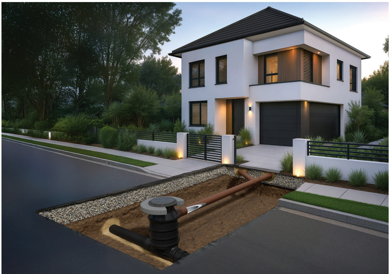
Vargosewage moderni troslojni kanalizacijski sustav

polipropilena s mineralnim punjenjem (skraćeni naziv materijala jest PP-MF), namijenjen učinkovitoj odvodnji otpadnih i kanalizacijskih voda te priključivanju na javnu kanalizacijsku mrežu. Sustav je proizveden u skladu s normom HRN EN 13476. Razvoj sustava temelji se na dugogodišnjemu iskustvu proizvođača u području cijevnih sustava. Vargon je započeo s radom 1990. kao obiteljsko poduzeće, a tijekom vremena razvio se u jednog od vodećih hrvatskih proizvođača plastičnih cijevnih sustava. Od 2022. posluje u sastavu Wienerberger grupe . Tijekom više od 35 godina neprekidnog