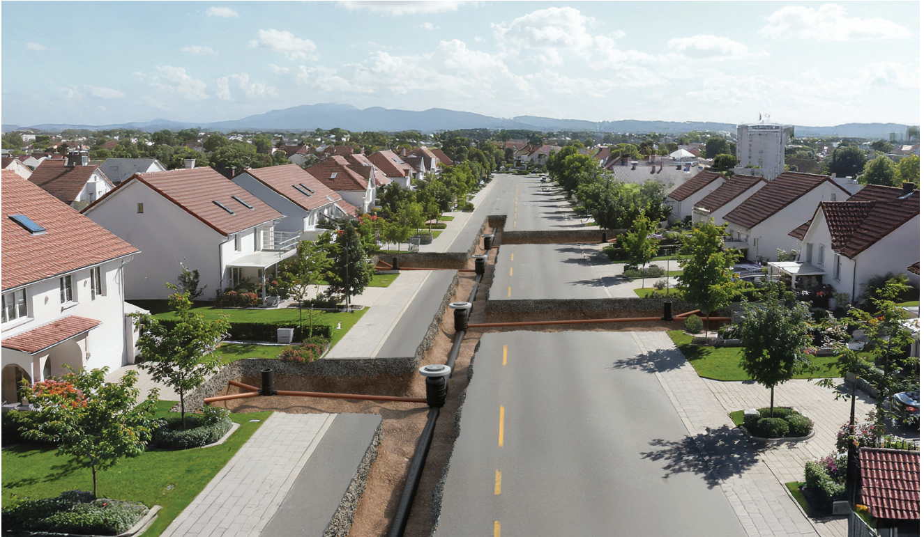
Vizualizacija Vargosewage sustava u naselju

Projektirani vijek trajanja sustava Vargosewage iznosi stotinu godina u uobičajenim uvjetima primjene. U odnosu na PVC cijevi, koje zahtijevaju češću sanaciju ili zamjenu, dugotrajnost polipropilenskih cijevi ima pozitivan utjecaj na ukupne troškove tijekom životnog ciklusa građevine. Njihov stvarni vijek trajanja ovisi o uvjetima ugradnje, opterećenjima i načinu korištenja sustava.