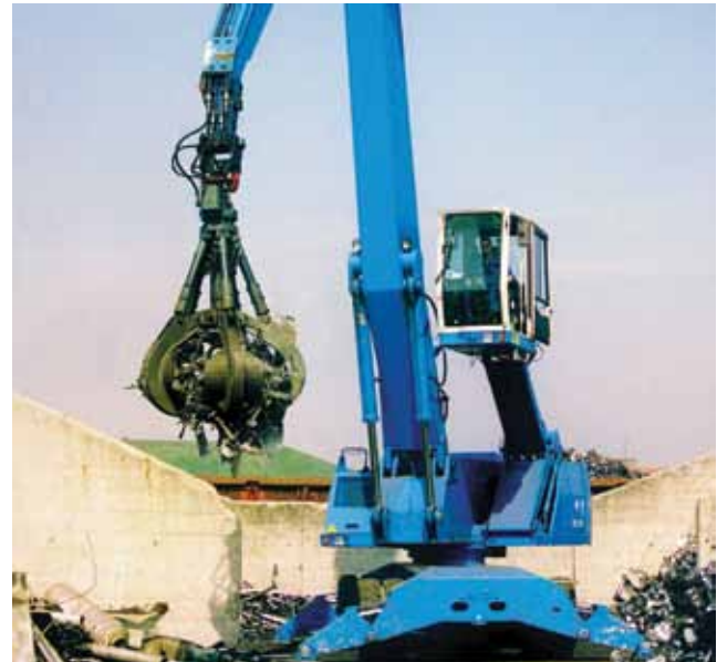
Slika 3. Prikaz rada grabfera (grabilice) pri pretovaru otpada [7]

Potrebna visina za rad ovakvog postrojenja je najmanje 15 m. Da bi se ostvario navedeni kapacitet od 25.000 t/god (ili 3,8 t/h) te za smještaj sva tri dijela proizvodnog procesa, potreban je prostor od 1500 m 2 s dodatnih minimalno 1000 m 2 manipulativnoga prostora. Komunalni otpad se izravno dovozi u prijemnu halu u kojoj je bazen za prihvata. Iznad bazena je ugrađena mosna dizalica s utovarivačem grabferom. Grabfer je višekraka grabilica (može biti i hidraulična) koja je ugrađena na hidraulični kran, a koristi se kao mehanička ruka za prikupljanje i transport rasutog i komadnog materijala, u ovome slučaju otpada (slika 3.).