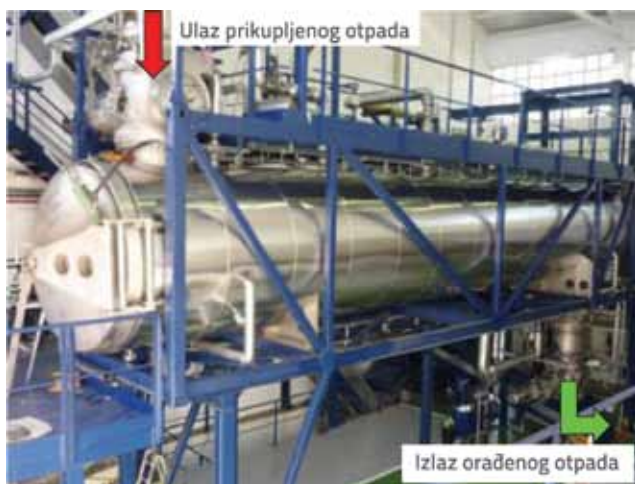
Slika 2. Postrojenje za termičku obradu otpada "Geiserbox" [6]

Potrebna visina za rad ovakvog postrojenja je najmanje 15 m. Da bi se ostvario navedeni kapacitet od 25.000 t/god (ili 3,8 t/h) te za smještaj sva tri dijela proizvodnog procesa, potreban je prostor od 1500 m 2 s dodatnih minimalno 1000 m 2 manipulativnoga prostora. Komunalni otpad se izravno dovozi u prijemnu halu u kojoj je bazen za prihvata. Iznad bazena je ugrađena mosna dizalica s utovarivačem grabferom. Grabfer je višekraka grabilica (može biti i hidraulična) koja je ugrađena na hidraulični kran, a koristi se kao mehanička ruka za prikupljanje i transport rasutog i komadnog materijala, u ovome slučaju otpada (slika 3.).