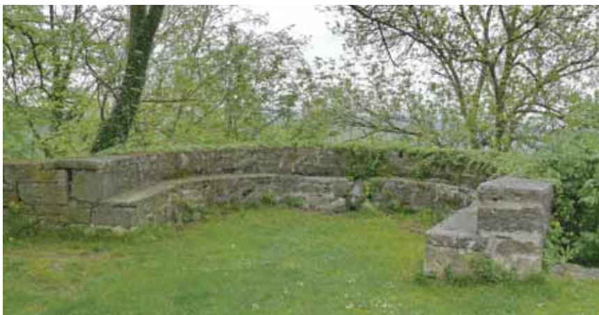
Dio lindarske utvrde s topom koji se vezuje uz kapetana Lazarića