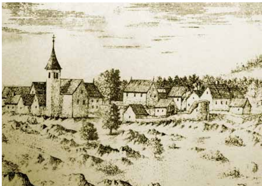
Kringa na Valvasorovu crtežu

Uz zapadni je ugao crkve samostojeći trokatni masivni zvonik pravokutnog tlocrta, natkriven poligonalnim tamburorom i osmerostranom piramidom. Visok je 30 m, a građen je od fino klesanih velikih kvadara s vijencima. Donji su mu dijelovi zvonika probijeni manjim prozorima, a najviši je kat sa zvonima na sve četiri strane otvoren biforama.