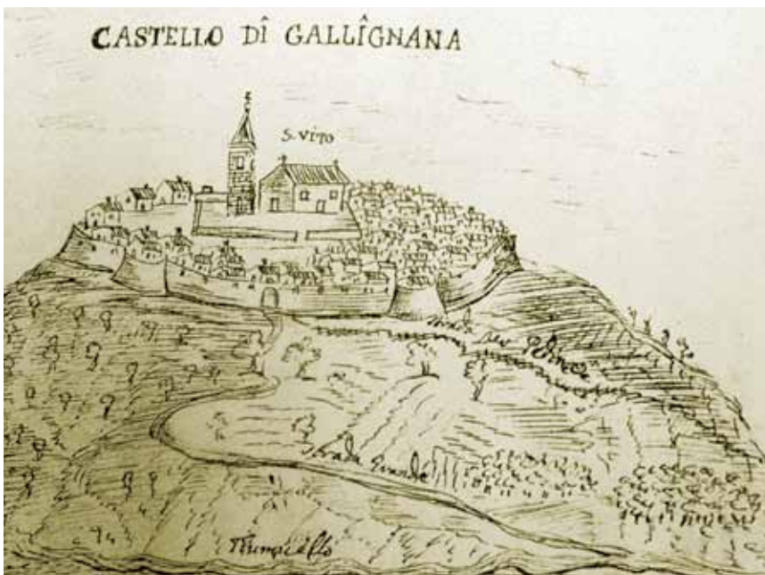
Lindar na prikazu Prospera Petronija u 17. st.

U Gračišću je bilo sedam crkava, a sačuvane su četiri od kojih je najpoznatija zavjetna crkva Sv. Marije, jedna od najvrjednijih istarskih gotičkih građevina