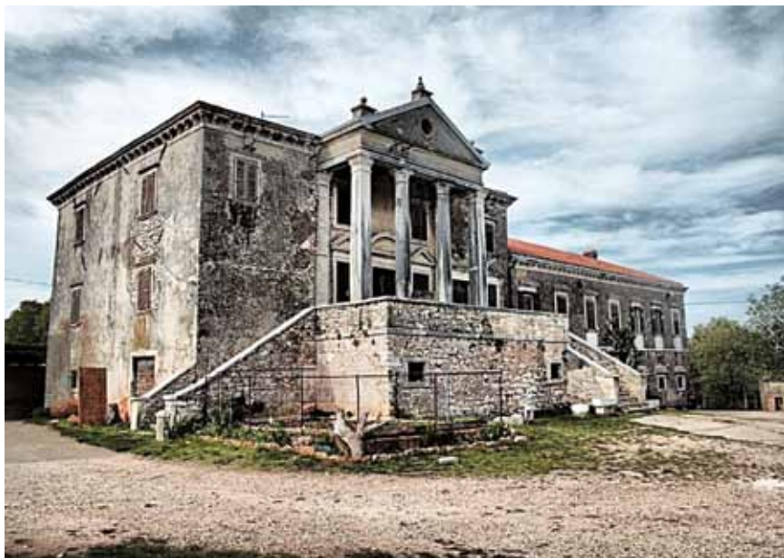
Monumentalni dvorac u Svetom Ivanu od Šterne

U Svetom Lovreču bilo je zapovjedništvo za cijeli istarski mletački posjed izvan gradova pa stoga se i naziva Sveti Lovreč Pazenatički