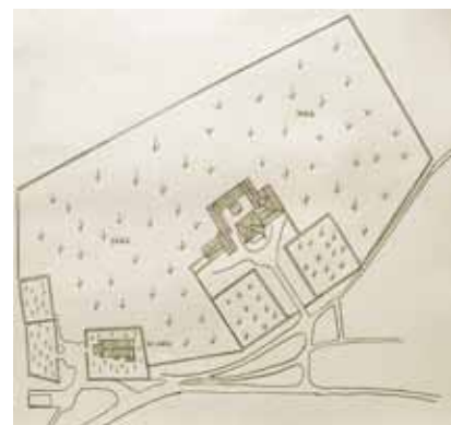
Tlocrt dvorca i parka Svetog Ivana od Šterne

U dokumentima se Sveti Ivan od Šterne prvi put spominje 1102. u već toliko puta isticanoj darovnici markgrofa Ulrika II. akvilejskoj crkvi kao selo Cisterna (Villa Cisterna). Vjerojatno je već u ranoj srednjem vijeku na tom mjestu postojala crkva sa selom kao feudalnim posjedom. Nakon što je 1420. Venecija osvojila Akvileju, Sveti Ivan postao je dijelom Mletačke Republike koja ga je davala u posjed raznim plemićkim obiteljima. Poput širega okolnog područja, Sveti Ivan od Šterne u ratovima i bolestima također je izgubio velik dio stanovništva, pa su ga mletačke vlasti u 16. st. naselile izbjeglicama pred Osmanlijama iz Dalmacije, Albanije i Crne Gore.