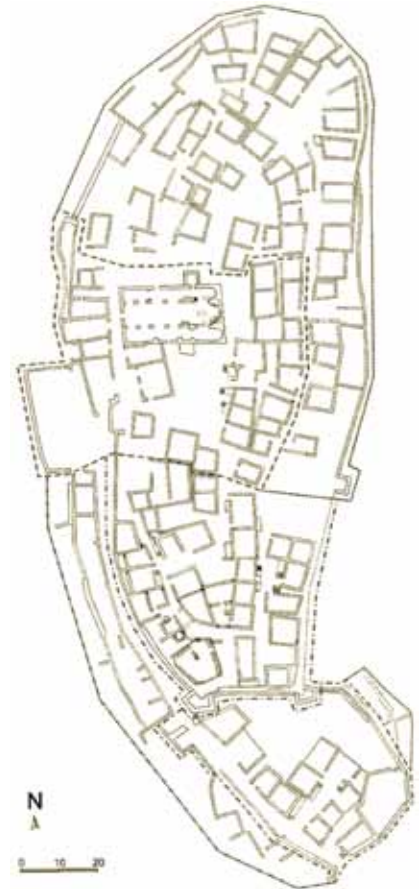
Tlocrt utvrđenog Dvigrada

uspomenu na susjednu utvrdu, možda i da sačuvaju neka stečena prava. Od susjednog Parentina nema nikakva traga jer je stanovnicima Monkastela dugo služio kao kamenolom, što se poslije događalo i Dvigradu. Nije poznato ni koji je od kaštela prvi izgrađen jer Parentino nikad nije arheološki istražen.