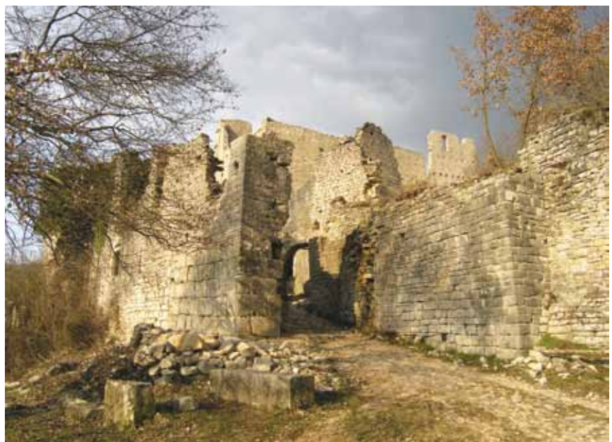
Glavni ulaz u utvrđeni Dvigrad

Sadašnji je oblik crkva dobila u doba romanike. Monumentalna trobrodna građevina pravokutnog tlocrta ima ravno začelje koje se sastoji od prije izgrađenih i prilagođenih dijelova. Apside su u tlocrtu polukružne, srednja je viša i veća, a južna pripada starijoj krstionici. Crkva je pretvorena u trobrodnu baziliku pa je znatno proširena i produljena. Srednji je brod neznatno uži od prijašnje predromaničke crkve, ali i gotovo dvostruko širi od pobočnih brodova koji su odijeljeni s pet pari četvrtastih zidanih stupova. Veći dio kamenih romaničkih ostataka pripada ciboriju koji je bio iznad oltarnog groba te ukrašen biljnim, geometrijskim i figurativnim motivima. Uzdužni su zidovi romaničke bazilike glatki i bez prozorskih otvora, pa je svjetlost ulazila kroz tri okrugla i četiri polukružna prozora na pročelju te kroz 12 visokih polukružnih prozora u povišenim zidovima srednjeg broda. Glavni je ulaz u baziliku bio s trga