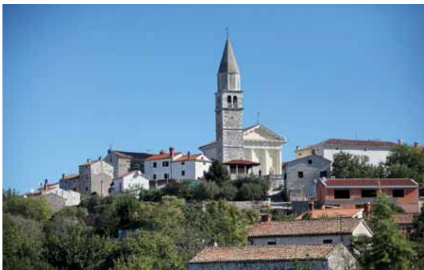
Crkva Sv. Kvirika i Julite u Višnjaju

i Julite iz 1833. koja zatvara trg sa sjeverne i zapadne strane. Ta jednobrodna i dugačka crkva, s velikom polukružnom apsidom i sakristijom te izrazitim klasicističkim pročeljem, monumentalnošću pomalo "kvari" rustičnu jednostavnost gradića. Pročelje je crkve pojačano kolonadom od četiri golema stupa koji pridržavaju trokutasti zabat sa stiliziranim Božjim Okom u čast zaštitnika crkve Sv. Kvirika i Julite. U crkvi je mnoštvo umjetničkih djela, a posebno se ističe glavni oltar sa svetohraništem i palom s likovima sv. Kvirika i Julite iz 17. st., slika Blažene Djevice Marije (rad poznatoga venecijanskog majstora Zorzi Venture iz 1598.) te stropne slikarije s prikazom mučenja Sv. Judite, starozavjetne mučenice.