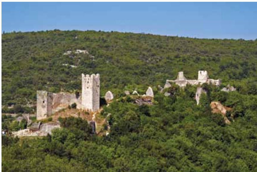
Pogled iz zraka na ruševine Dvigrada

U crkvi Sv. Sofije u Dvigradu sačuvani su starokršćanski tragovi iz 5. st., predromanički ostaci iz 8. st., a konačni je oblik dobila u romaničkom razdoblju