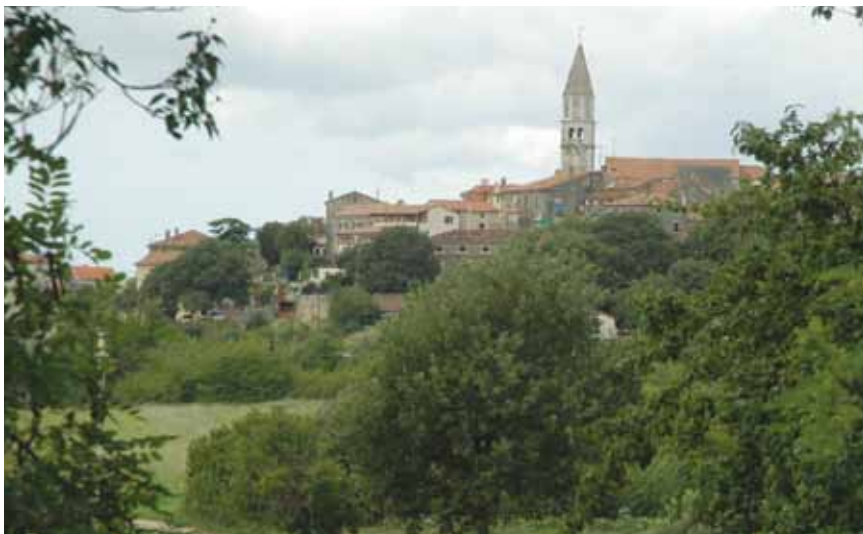
Stara gradska jezgra Višnjana (pogled s jugoistoka)

gnuta je početkom 17. st. gradska loža. Srušena je 1765. i na njezinom je mjestu podignuta barokna loža s pogledom na cijelu porečku obalu, od Umaga do Vrsara. Kvadratna je to građevina koja je s tri strane otvorena stupovima i pokrivena niskim pravokutnim piramidalnim krovom. S južne strane trg zatvara današnja općinska palača, na koju se naslanja dio negdašnjih fortifikacija sa sačuvanim unutrašnjim gradskim vratima, zvanim Vela ili Stara vrata (Porta Grande ili Porta Vecchia), ukrašena grbom mletačkoga lava koja su oblikom gotovo istovjetna onima u Gologorici.