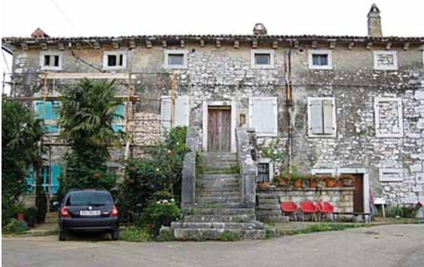
Dvokatnica u Gradini na mjestu negdašnjeg kaštela

U dokumentima se prvi put spominje kao središte feuda kojega je Acika zajedno s limskim ribnjacima darovala tršćanskom biskupu Adalgeru, a od 1186. posjed je u zakupu već spomenutoga pulskog plemića Girola. Njegovi su potomci držali utvrdu i posjed sve do izumiranja 1592., a potom ga je mletačka vlast dodijelila obitelji Capello. Ta je obitelj držala utvrdu sve do kraja 18. st. kada je novim gospodarom postala rovinjska plemićka obitelj Califfi. Oni su Gradinu držali u posjedu sve do 1848.