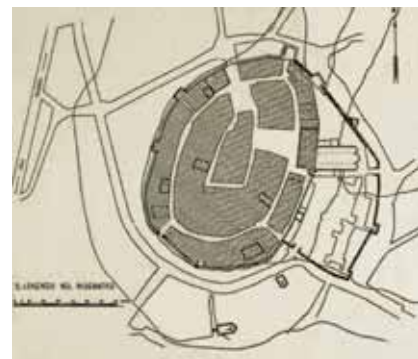
Tlocrt utvrđenog središta Sv. Lovreča