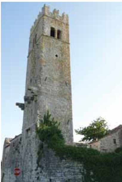
Samostojeći zvonik i kula crkve Sv. Martina

Cijelim gradom dominira veliki Trg Placa gdje se sastaju negdašnji južni i istočni gradski prilazi. S južne su strane u gradskim bedemima vrata sa šiljatim gotičkim portalom iz 1407., a naknadno je (1547.) pokraj ulaza dodana kamena ploča s jednim pomalo neobičnim natpisom ("vidistis, videtis, videbitis" – vidjeli ste, vidite, vidjet ćete). Na vršku se gotičkog luka nalazi plosnata kamena čovjekolika pseća glava za koju se vjeruje da prikazuje hunskog vojskovođu Atilu kojega istarska predaja uvijek zamišlja kao čovjeka-psa. Zanimljivost je