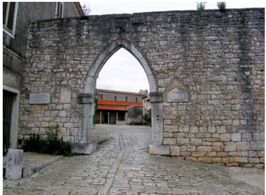
Slika 9. Gradska vrata s gotičkim portalom