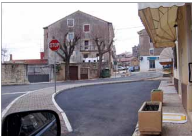
Detalj iz sjedišta Višnjana

Sljedeći je kaštel na širokom prostoru između Poreča i Pazina Sveti Ivan od Šterne (tal. San Giovanni della Cisterna ), smješten u središtu manjeg naselja, tri kilometra sjeverno od Baderne u općini Višnjan na lokalnoj cesti za Majkuse i Muntrilj, petstotinjak metara istočno od državne ceste Pula – Buje. Poput brojnih drugih istarskih kaštela ili naselja istog imena, prvi je dio imena nastao prema crkvi Sv. Ivana iz 14. st.,