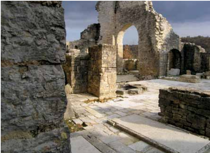
Djelomično konzervirani ostaci crkve Sv. Sofije u Dvigradu

predromaničko je svetište završavalo s tri odijeljena prostora od kojih je srednji bio nešto veći, ali su apside nadsvođene školjkama s lukovima. Čini se da je tada crkva bila i temeljito oslikana. Nešto poslije toga (u 9. ili 10 st.) s južne su strane uz troapsidnu dvoransku crkvu dograđeni krstionica i zvonik, a potom, u ranoj romanici i sjeverna kapelica.