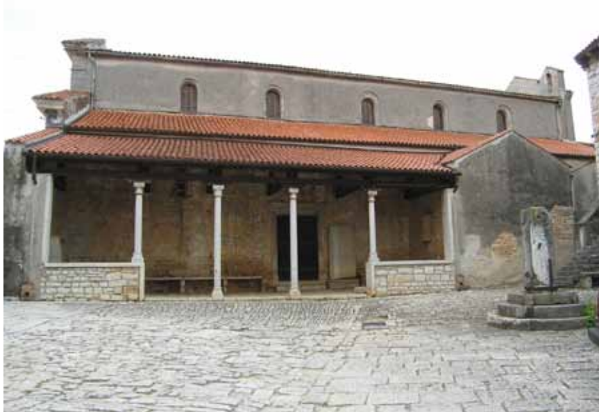
Crkva Sv. Martina s gradskom ložom

Na krševitom brežuljku što se uzdiže lijevo od vijugave ceste koja se od stare prometnice Pula – Trst iznad Limskog kanala odvaja prema Vrsaru, ostaci su još jednoga važnoga istarskog kaštela. Riječ je o Gradini (tal. Calisedo i Geroldia ), srednjovjekovnom utvrđenom naselju u sadašnjoj općini Sv. Lovreč s kraja 11. ili početkom 12. st. Izgrađeno je za nadzor plovidbe Limskim kanalom preko kojeg je još od prapovijesti preko rimskoga doba i srednjega vijeka vodio put iz središnje Istre prema zapadnoj obali Istre. Naziv je kaštela nesumnjivo hrvatskog podrijetla, vjerojatno još i prije nego što je 1040. pod imenom Castrum Calixedi spominje kao posjed istarskog kneza Vecelina i njegove kćeri Acike, kneginje i poslije markgrofice. Ime Geroldia dobio je krajem 12. st. prema plemiću Giroldu iz Pule ( dominus Giroldus de Pola ) koji ga je od tršćanskog biskupa uzeo u zakup.