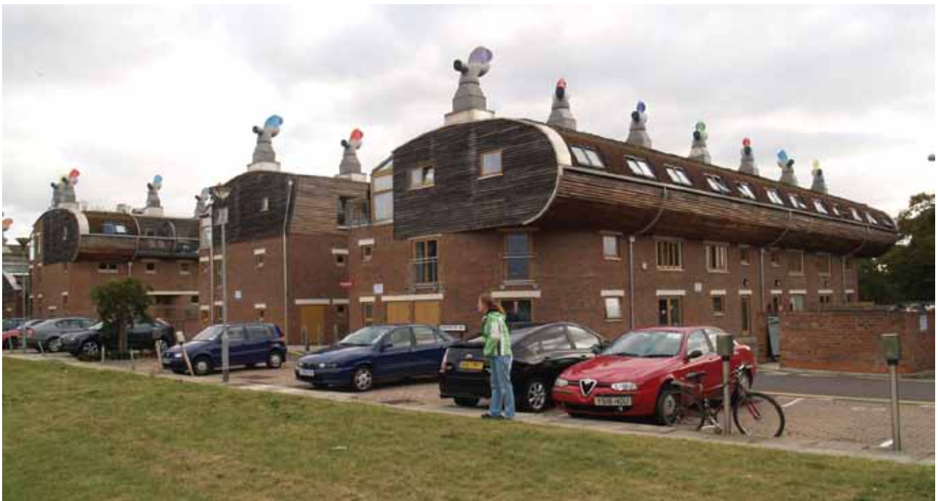
Parkirališta imaju uređaje za punjenje električnih automobila.

Stoga je projekt BedZED, zapravo, izravno utjecao i na sve veće gradove u Velikoj Britaniji.