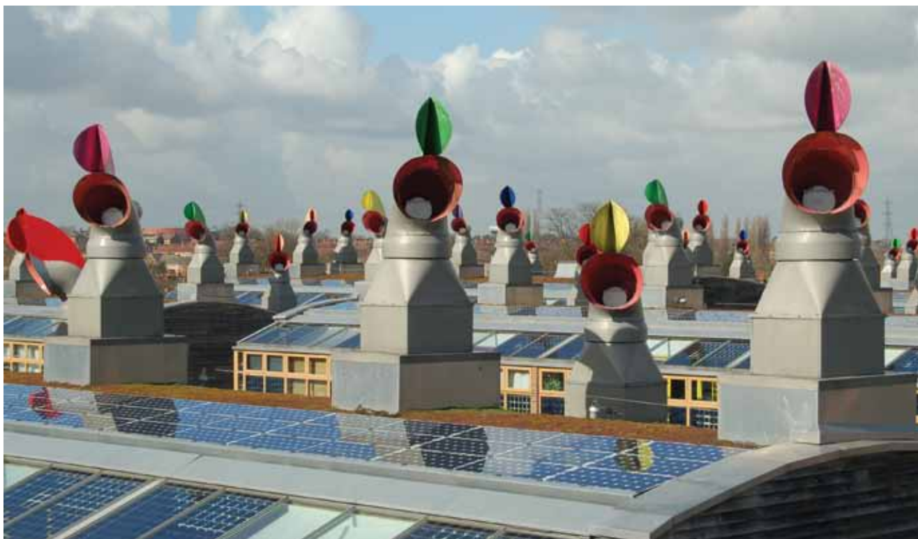
"Hvatači vjetra" za prirodnu ventilaciju stanova i poslovnih prostora - prepoznatljiva slika BedZED-a

BedZED ima posebna postrojenja za pročišćavanje vode, a postoji i zasebna elektrana koja upotrebljava drveni otpad u kombinaciji sa sunčanim kolektorima kojih je na krovovima naselja ugrađeno 770 m 2 . Iako je elektrana u stanju zadovolji potražnju cijelog naselja, troškovi i osoblje za održavanje izolirane energetske stanice takve veličine mogu ipak biti previsoki. Stoga će se taj problem pokušati prevladati tako da se obje tehnologije počnu upotrebljavati u cijelom južnom dijelu Londona. Za grijanje se vode upotrebljavala i biomasa, a spremnici su tople vode trebali zadovoljiti zahtjeve i za najveću dnevnu potrošnju jer je za grijanje potrebno vrlo malo energije. Radi se naime o niskoenergijskim građevinama (najveća potrošnja 30 kWh/m 2 na godinu) pa elektrana opskrbljuje naselje samo električnom energijom, a najčešće je isporučuje u električnu mrežu.